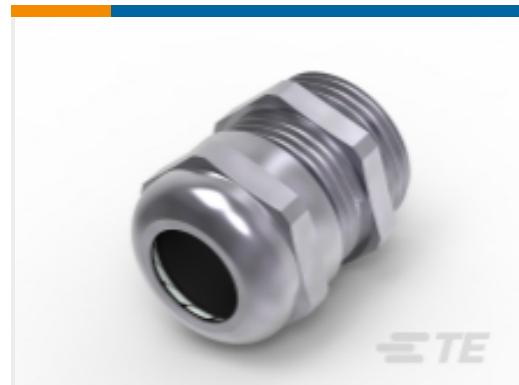
TE 产品编号T3609320112-000 DLX-32-MT