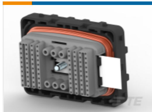
TE 产品编号DRCP28-86SB PLG, 86P, BLK, 12/20, B