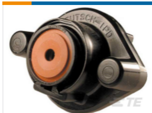
TE 产品编号DTHD04-1-4P-L009 REC, 1P, BLK, N, SIZE 4, FLANGE