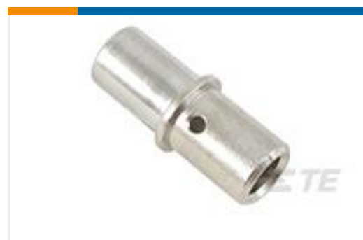
TE 产品编号0462-203-04141 SOC, SOLID, SIZE 4, 6AWG, NI