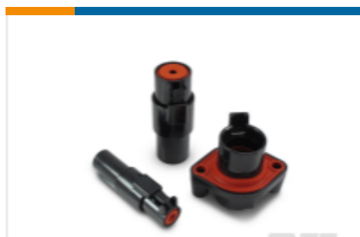
TE 产品编号DTHD06-1-12S DEUTSCH DTHD Housings