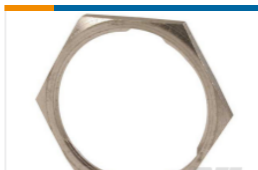
TE 产品编号112263-90 PANEL NUT, SIZE 24, HD30