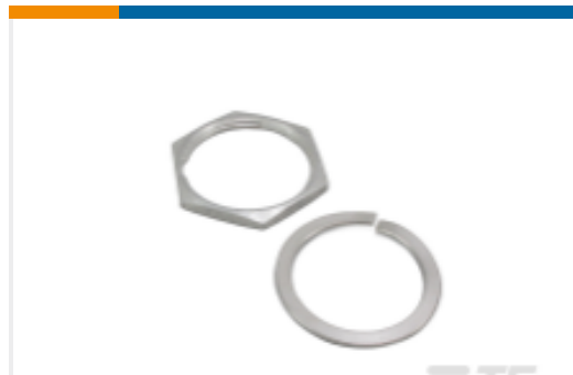
TE 产品编号112263-90 Mounting Hardware for DEUTSCH HD30 Connectors