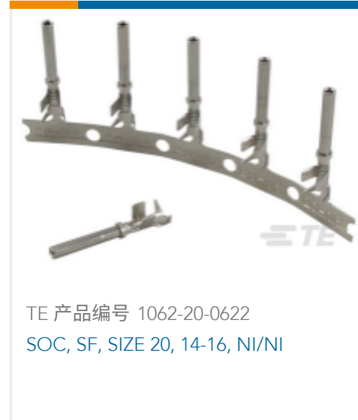
TE 产品编号 1062-20-0622 SOC, SF, SIZE 20, 14-16, NI/NI