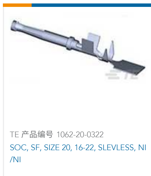
TE 产品编号 1062-20-0322 SOC, SF, SIZE 20, 16-22, SLEVLSS, NI /NI