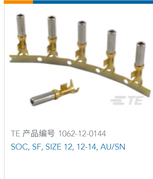
TE 产品编号 1062-12-0144 SOC, SF, SIZE 12, 12-14, AU/SN