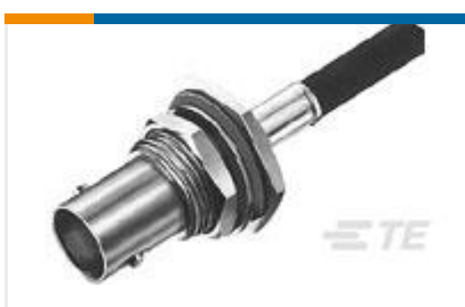
TE 产品编号1-1337433-0 BNC RM BHJ Hex 50Ohm Nickel Pltd RG58C/U