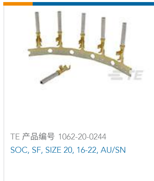
TE 产品编号 1062-20-0244 SOC, SF, SIZE 20, 16-22, AU/SN