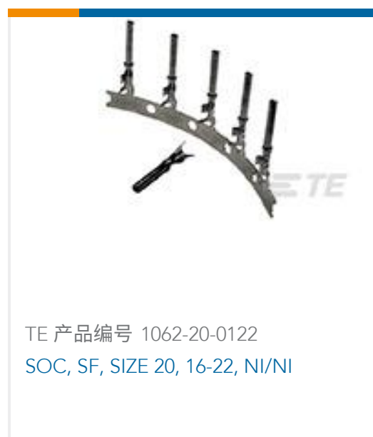
TE 产品编号 1062-20-0122 SOC, SF, SIZE 20, 16-22, NI/NI