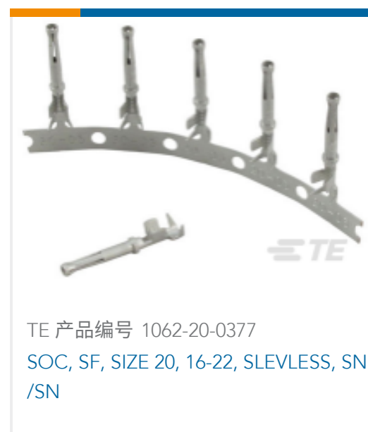
TE 产品编号 1062-20-0377 SOC, SF, SIZE 20, 16-22, SLEVLSS, SN /SN