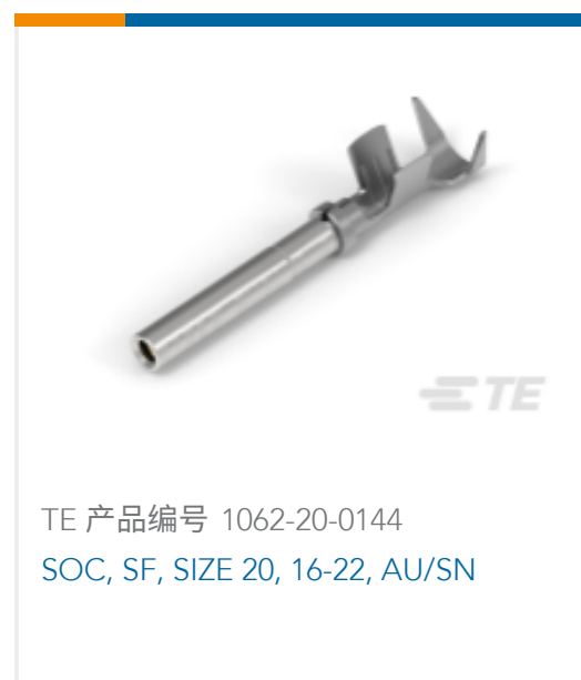
TE 产品编号 1062-20-0144 SOC, SF, SIZE 20, 16-22, AU/SN