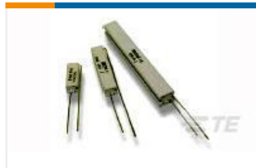
TE 产品编号1623732-7 BCHE 7 W 150R 5%