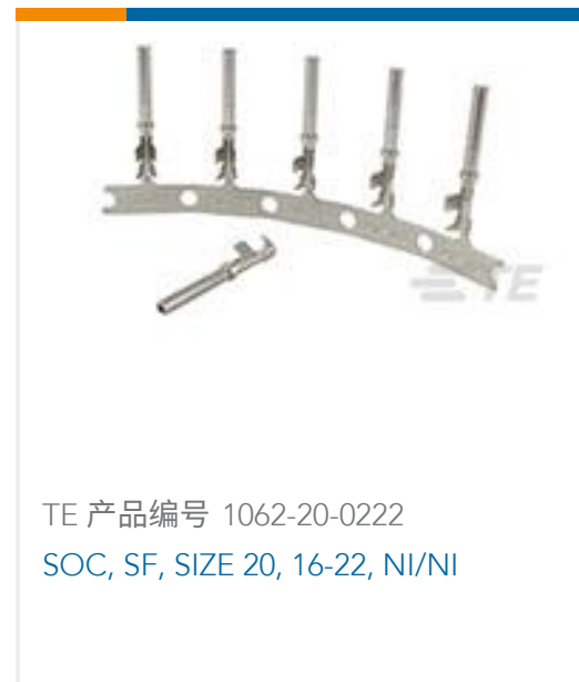
TE 产品编号 1062-20-0222 SOC, SF, SIZE 20, 16-22, NI/NI