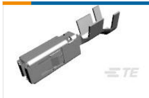
TE 产品编号1241396-2 AMP MCP 2.8K, CONTACT, SWS