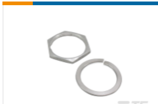
TE 产品编号112263-90 Mounting Hardware for DEUTSCH HD30 Connectors