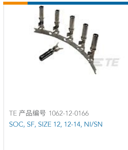
TE 产品编号 1062-12-0166 SOC, SF, SIZE 12, 12-14, NI/SN