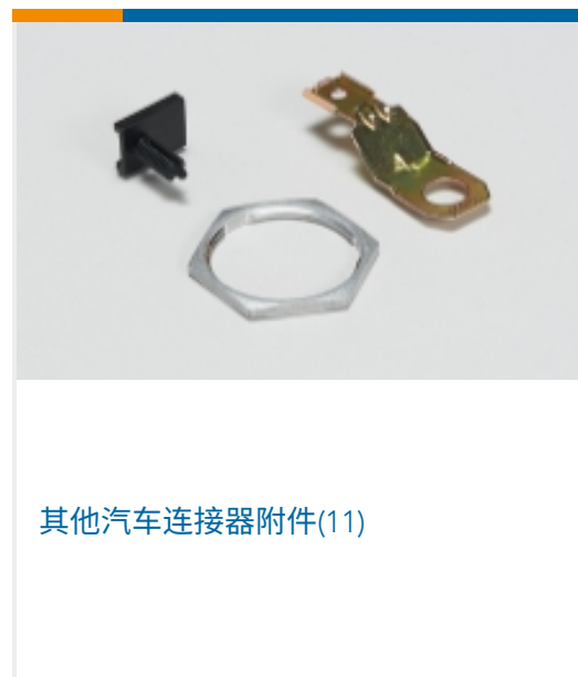
其他汽车连接器附件(11)