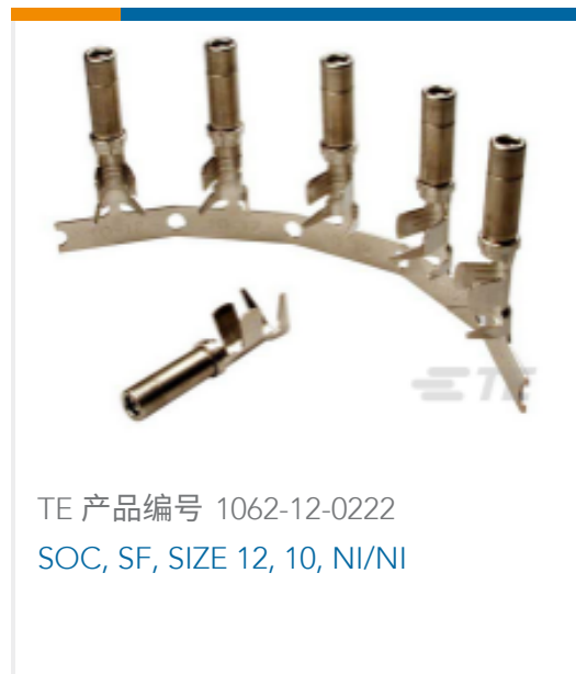
TE 产品编号 1062-12-0222 SOC, SF, SIZE 12, 10, NI/NI