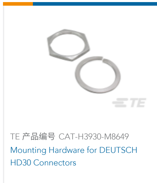
TE 产品编号 CAT-H3930-M8649 Mounting Hardware for DEUTSCH HD30 Connectors