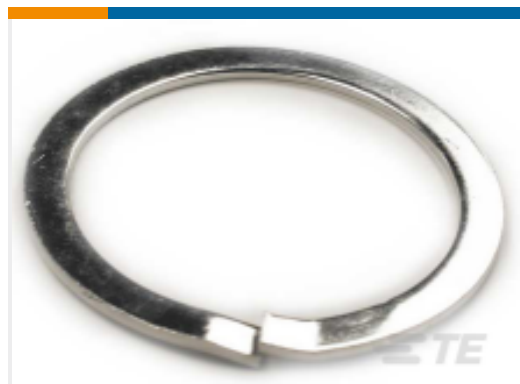
TE 产品编号112264-ZZ LOCKWASHER, SIZE 24, HD30