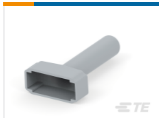
TE 产品编号DTM12S-BT BOOT, 12P, PLG, ST, GRY