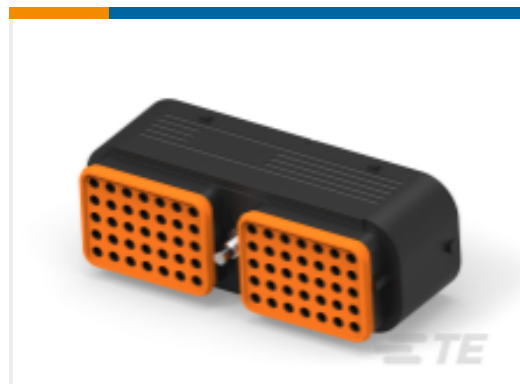
TE 产品编号DRC16-70SAE-P066 PLG, 70P, BLK, E, SPECIAL SEAL, A