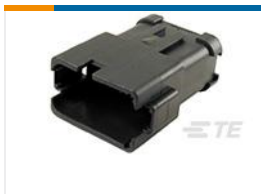
TE 产品编号DT04-12PB-P021 REC, 12P, BLK, BUSBAR 1X12, NICKEL, B