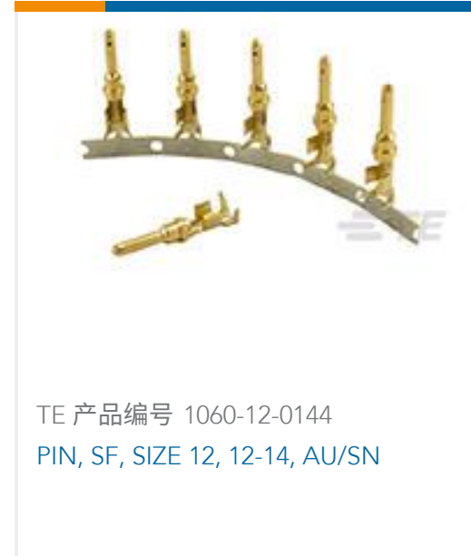
TE 产品编号 1060-12-0144 PIN, SF, SIZE 12, 12-14, AU/SN