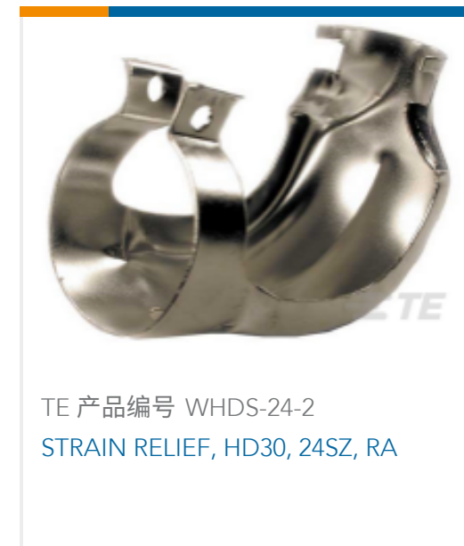
TE 产品编号 WHDS-24-2 STRAIN RELIEF, HD30, 24SZ, RA