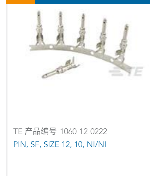
TE 产品编号 1060-12-0222 PIN, SF, SIZE 12, 10, NI/NI