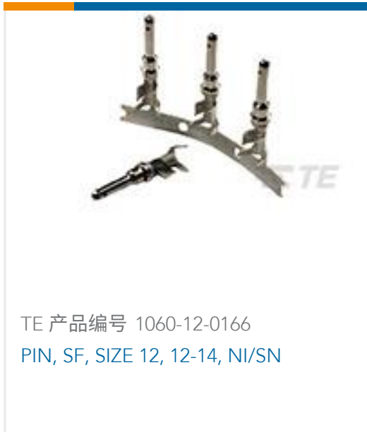
TE 产品编号 1060-12-0166 PIN, SF, SIZE 12, 12-14, NI/SN