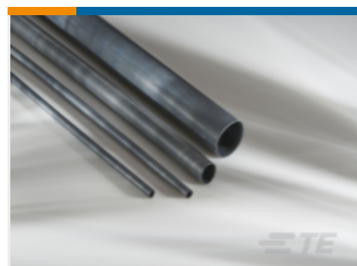
TE 产品编号EH2299-000 DWFR-24/6-0-STK