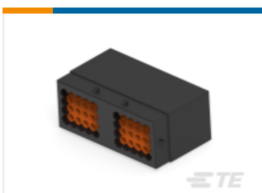
TE 产品编号DRC14-40PBE REC, 40P, BLK, E, B