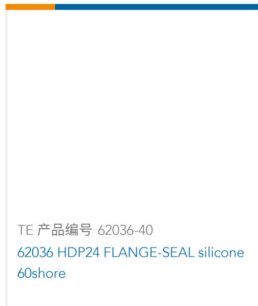
TE 产品编号 62036-40 62036 HDP24 FLANGE-SEAL silicone 60shore