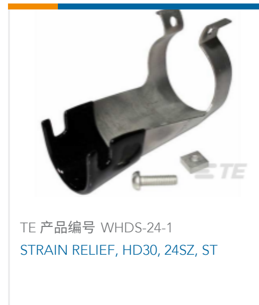
TE 产品编号 WHDS-24-1 STRAIN RELIEF, HD30, 24SZ, ST