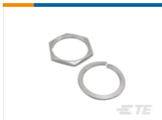
TE 产品编号112263-90 Mounting Hardware for DEUTSCH HD30 Connectors