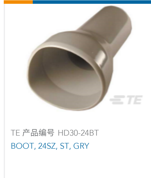
TE 产品编号 HD30-24BT BOOT, 24SZ, ST, GRY