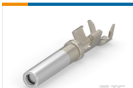
TE 产品编号1062-16-0122-PS SOC, SF, SIZE 16, 14-18, NI/SN, 100 PC