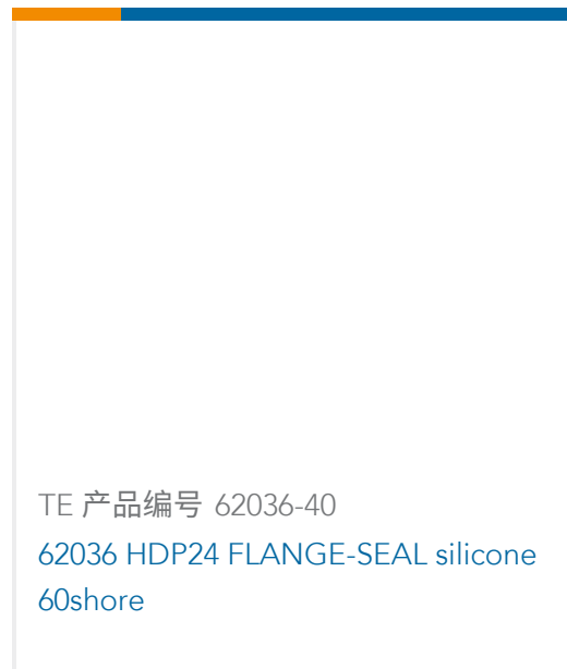
TE 产品编号 62036-40 62036 HDP24 FLANGE-SEAL silicone 60shore