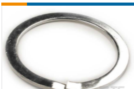
TE 产品编号112264-ZZ LOCKWASHER, SIZE 24, HD30