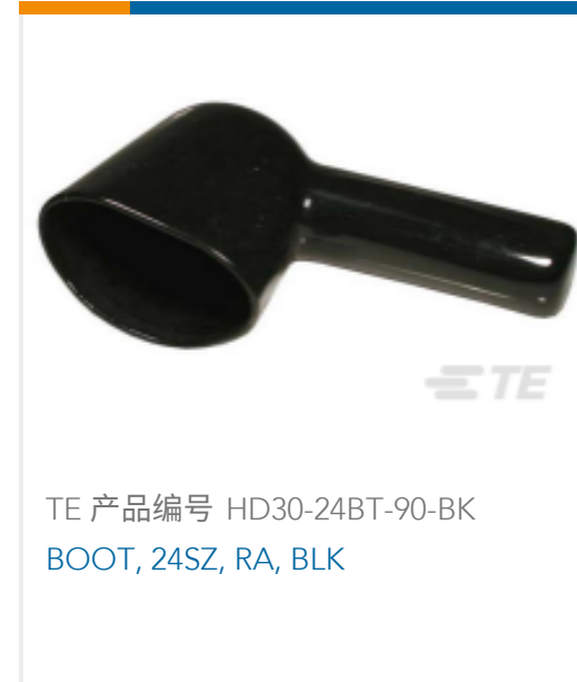
TE 产品编号 HD30-24BT-90-BK BOOT, 24SZ, RA, BLK