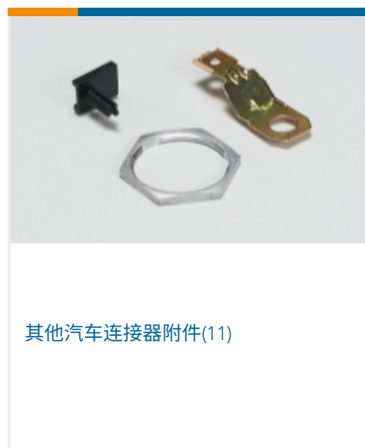
其他汽车连接器附件(11)