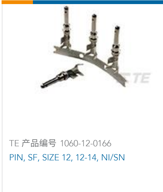
TE 产品编号 1060-12-0166 PIN, SF, SIZE 12, 12-14, NI/SN