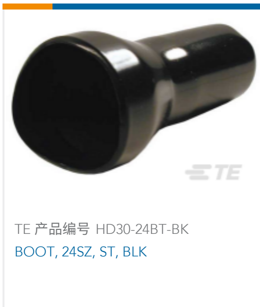
TE 产品编号 HD30-24BT-BK BOOT, 24SZ, ST, BLK