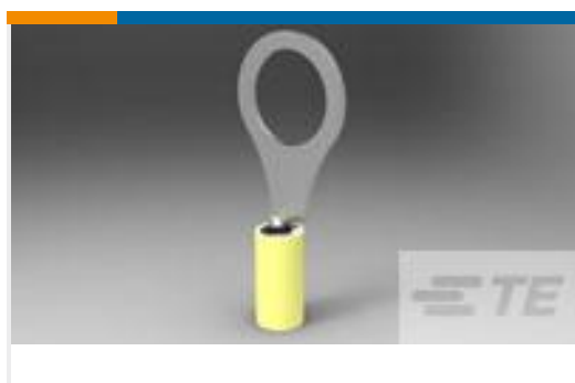
TE 产品编号8-35111-1 TERMINAL, PIDG R 12-10 5/16