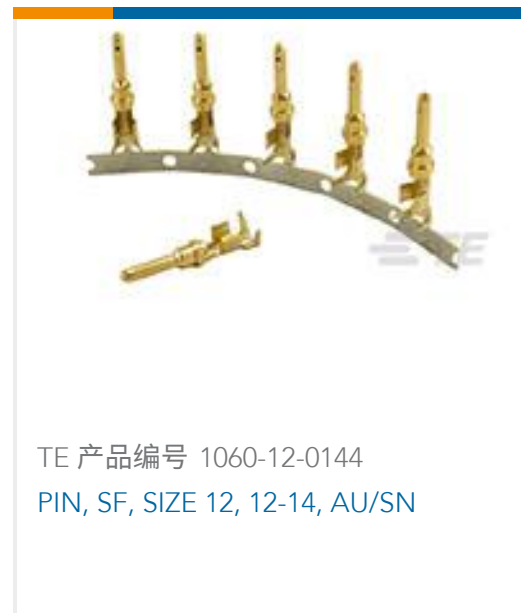
TE 产品编号 1060-12-0144 PIN, SF, SIZE 12, 12-14, AU/SN