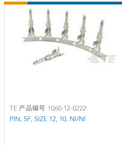
TE 产品编号 1060-12-0222 PIN, SF, SIZE 12, 10, NI/NI