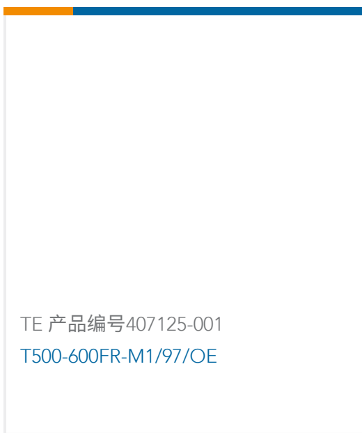
TE 产品编号407125-001 T500-600FR-M1/97/OE