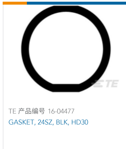
TE 产品编号 16-04477 GASKET, 24SZ, BLK, HD30