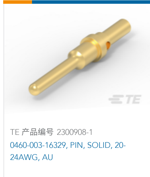
TE 产品编号 2300908-1 0460-003-16329, PIN, SOLID, 20- 24AWG, AU