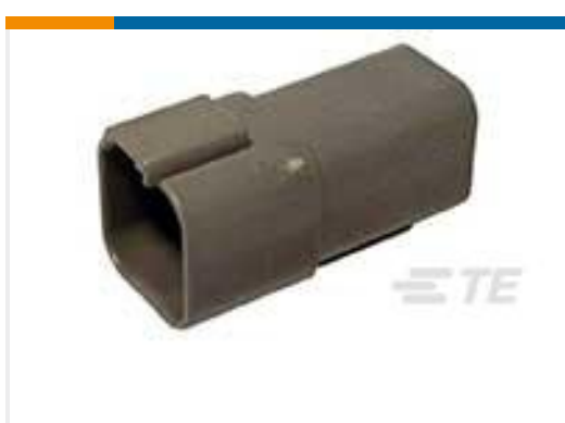
TE 产品编号DT04-6P-P004 REC, 6P, GRY, N