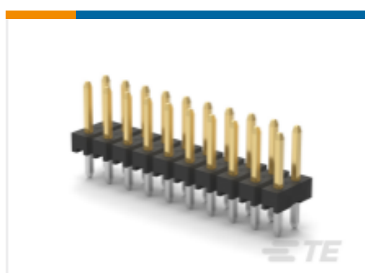
TE 产品编号2842132-6 12P,2MM,BRK HDR,DRV,2.8,0.76AU, TB W/CAP