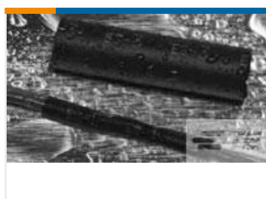
TE 产品编号EG9830-000 ES2000-NO.11-P1-0-27MM