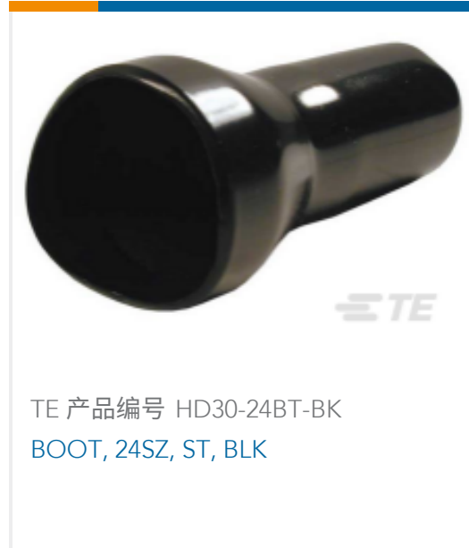
TE 产品编号 HD30-24BT-BK BOOT, 24SZ, ST, BLK