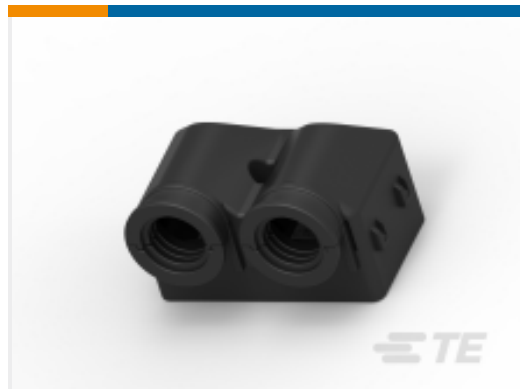
TE 产品编号0528-002-6005 BKSHL, 60P, BLK, PLG, RA, NW 17