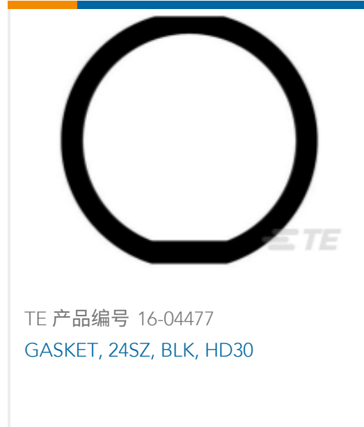
TE 产品编号 16-04477 GASKET, 24SZ, BLK, HD30