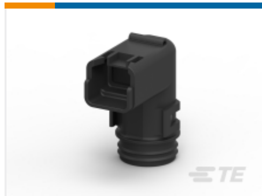
TE 产品编号1011-228-0205 BKSHL, 2P, BLK, PLG, RA, NW6/7.5/8.5 /10