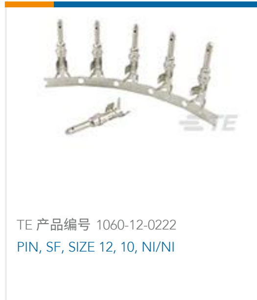
TE 产品编号 1060-12-0222 PIN, SF, SIZE 12, 10, NI/NI