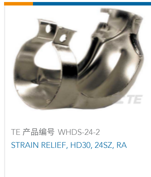
TE 产品编号 WHDS-24-2 STRAIN RELIEF, HD30, 24SZ, RA