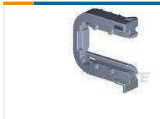
TE 产品编号1670720-2 SLIDE,TAB HSG GROUP C /10