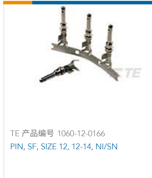
TE 产品编号 1060-12-0166 PIN, SF, SIZE 12, 12-14, NI/SN