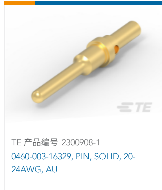
TE 产品编号 2300908-1 0460-003-16329, PIN, SOLID, 20- 24AWG, AU