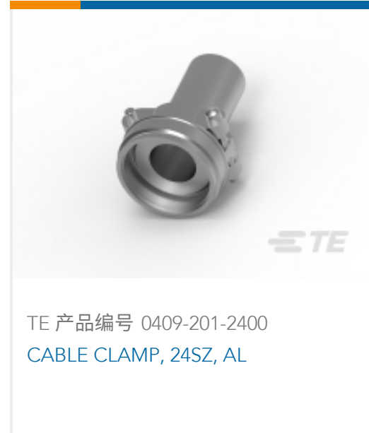
TE 产品编号 0409-201-2400 CABLE CLAMP, 24SZ, AL