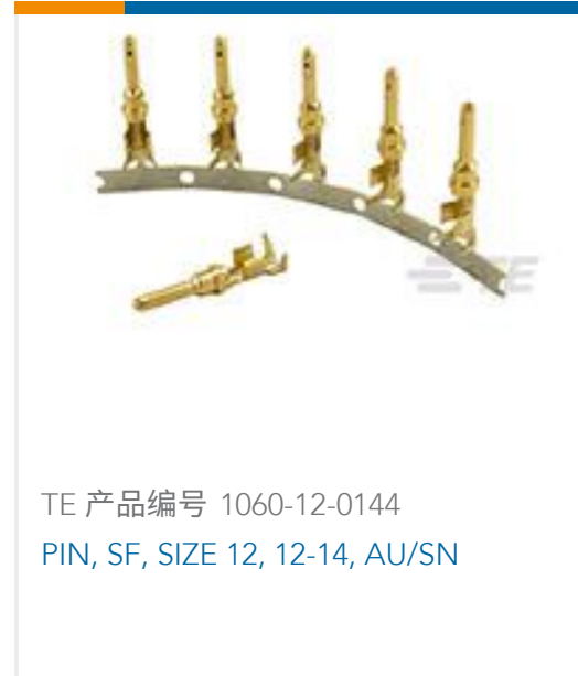
TE 产品编号 1060-12-0144 PIN, SF, SIZE 12, 12-14, AU/SN