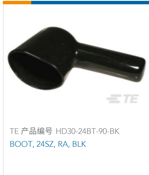
TE 产品编号 HD30-24BT-90-BK BOOT, 24SZ, RA, BLK