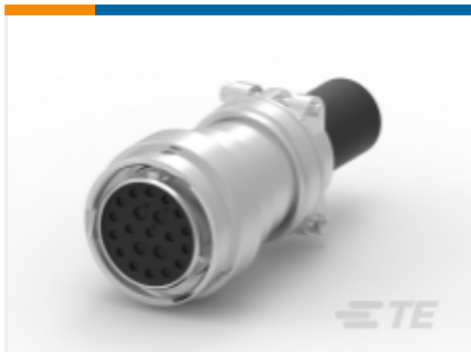
TE 产品编号HD36-24-21SE-059 PLG,21P,AL,E,CBLCLMP BT,DRAIN,12 /16,S,MC