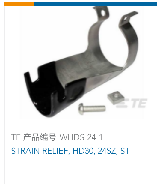
TE 产品编号 WHDS-24-1 STRAIN RELIEF, HD30, 24SZ, ST