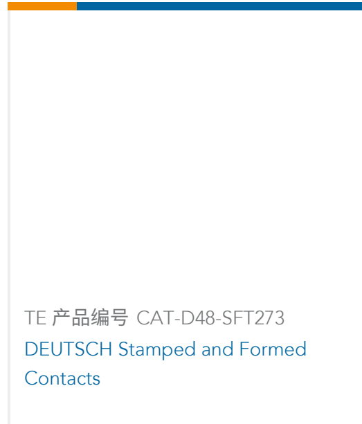
TE 产品编号 CAT-D48-SFT273 DEUTSCH Stamped and Formed Contacts