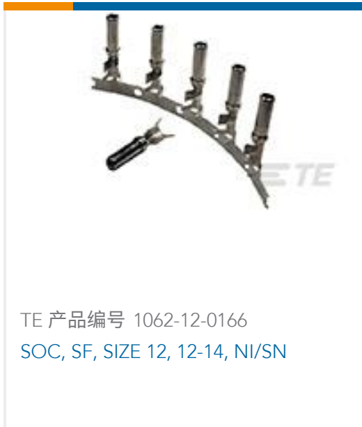
TE 产品编号 1062-12-0166 SOC, SF, SIZE 12, 12-14, NI/SN