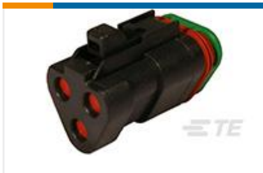
TE 产品编号DT06-3S-CP01 PLG, 3P, BLK, BLOCKED, SEAL RET