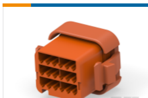
TE 产品编号DT06-18SD PLG, 18P, BRN, N, D