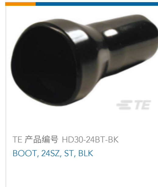
TE 产品编号 HD30-24BT-BK BOOT, 24SZ, ST, BLK