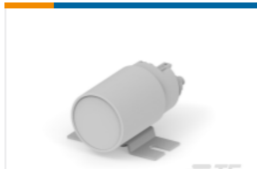
TE 产品编号K1021419 Relay 29-314-12-900