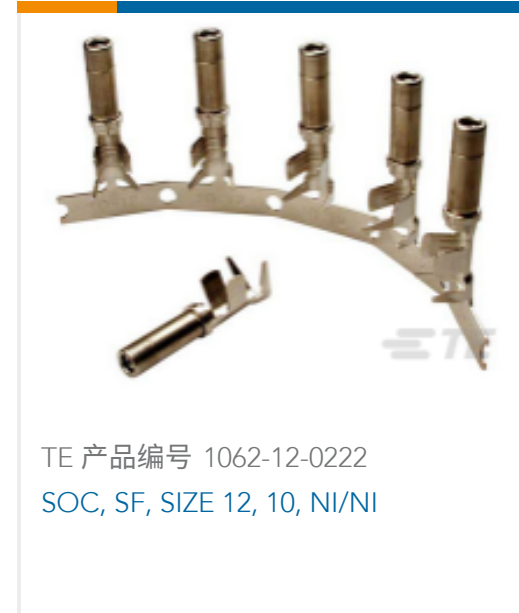
TE 产品编号 1062-12-0222 SOC, SF, SIZE 12, 10, NI/NI