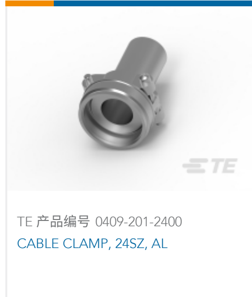
TE 产品编号 0409-201-2400 CABLE CLAMP, 24SZ, AL