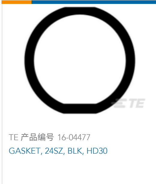
TE 产品编号 16-04477 GASKET, 24SZ, BLK, HD30