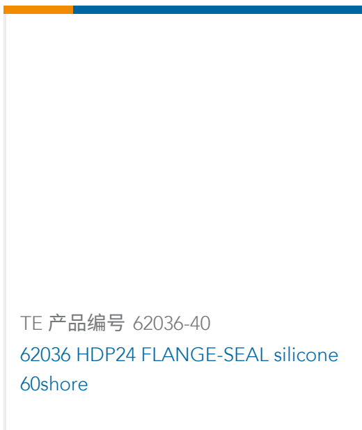
TE 产品编号 62036-40 62036 HDP24 FLANGE-SEAL silicone 60shore