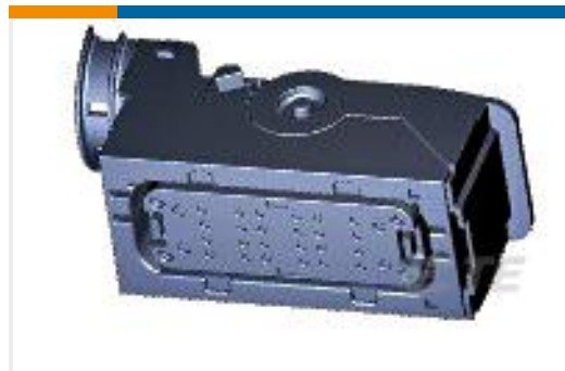
TE 产品编号2138839-2 PLUG ASSY, 28 POS, KEY B, AMPSEAL 16 HL