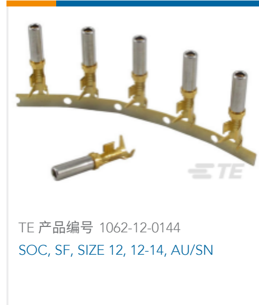
TE 产品编号 1062-12-0144 SOC, SF, SIZE 12, 12-14, AU/SN