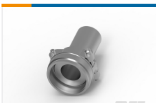
TE 产品编号0409-201-2400 CABLE CLAMP, 24SZ, AL