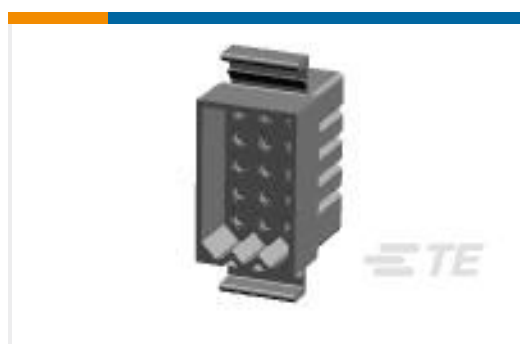
TE 产品编号770106-1 15P .093 COMM P&S PLUG