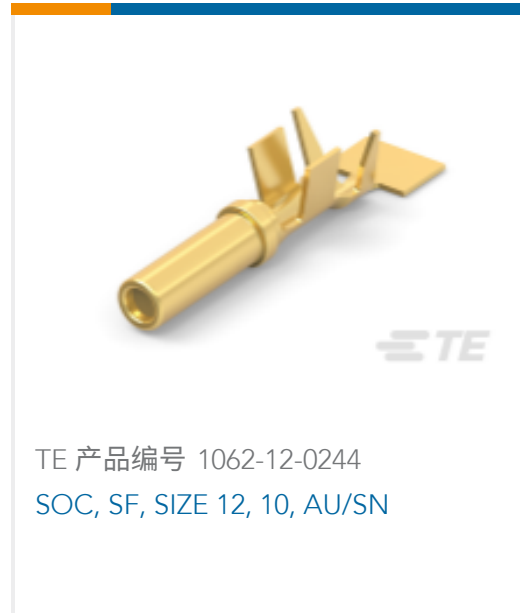
TE 产品编号 1062-12-0244 SOC, SF, SIZE 12, 10, AU/SN