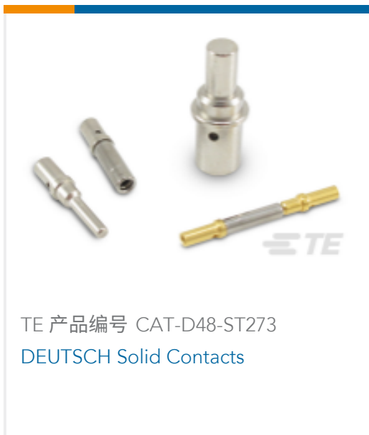
TE 产品编号 CAT-D48-ST273 DEUTSCH Solid Contacts