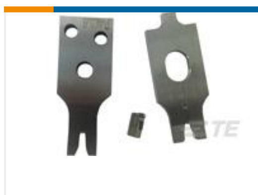
TE 产品编号7-2151593-7 OCEAN_2.0_SPARE_PART_KIT-080F090F