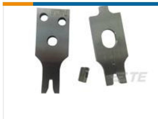
TE 产品编号7-2151725-7 OCEAN_2.0_SPARE_PART_KIT-053F061O