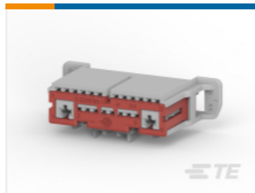
TE 产品编号2295163-2 22POS, MIXED, REC HSG, ASSY