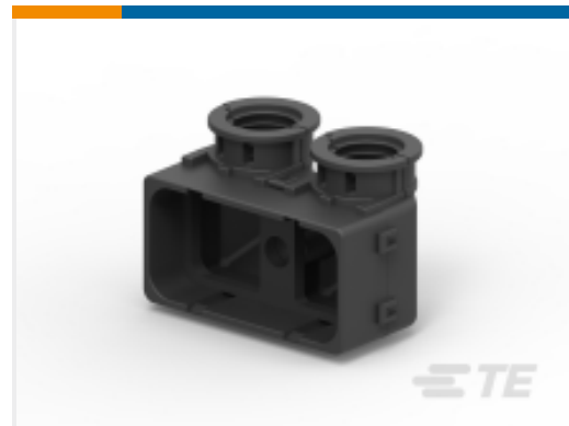
TE 产品编号0528-001-5005 BKSHL, 50P, BLK, PLG, RA, NW 17