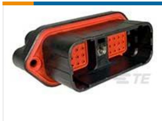
TE 产品编号DRC22-40PA 40P RECP ASM