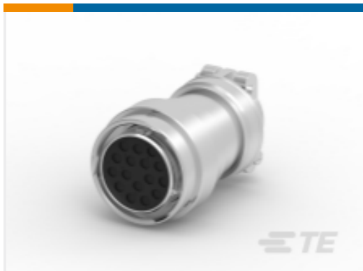
TE 产品编号HD36-24-16SN-059 PLG,16P,AL,N, CBL CLMP BT, DRAIN, 12,S,MC