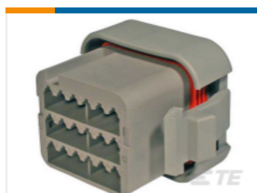
TE 产品编号DTV06-18SA PLG, 18P, GRY, N, A