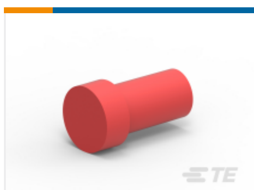
TE 产品编号114019-ZZ SEALING PLUG, SIZE 4, WHT