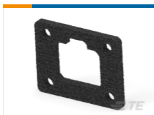
TE 产品编号DT4P-L012-GKT GASKET, 4P, BLK, DT/DTM