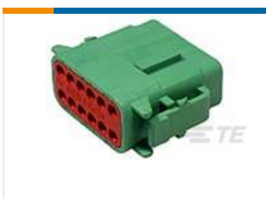
TE 产品编号DTM06-12SC PLG, 12P, GRN, N, C