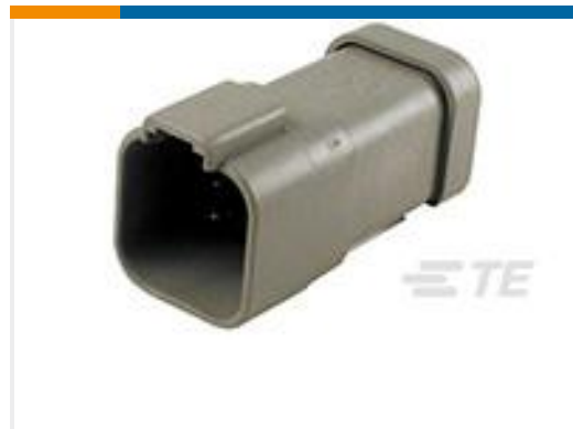
TE 产品编号DT04-6P-P021 REC, 6P, GRY, BUSBAR 1X6, NICKEL