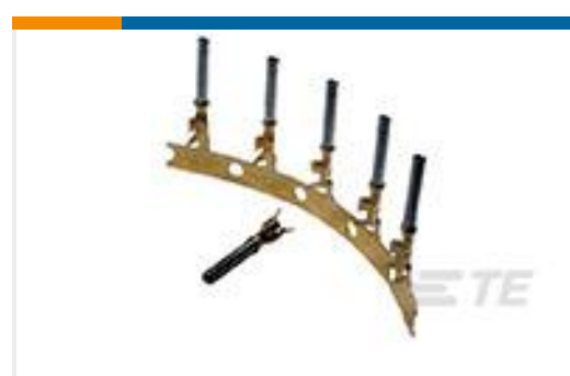
TE 产品编号1062-20-0144 SOC, SF, SIZE 20, 16-22, AU/SN