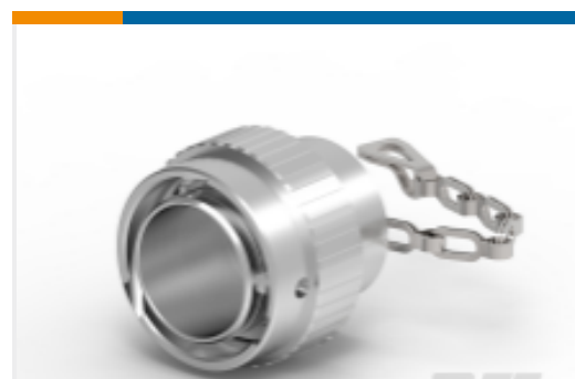
TE 产品编号HDC36-18 DUST CAP, 18SZ, REC, AL, LANYARD, HD30