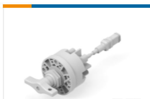
TE 产品编号K1166144 Battery Disconnect 35-523-241-R-A2- 901