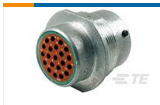
TE 产品编号HD34-18-21PN REC, 21P, AL, N, 20, P