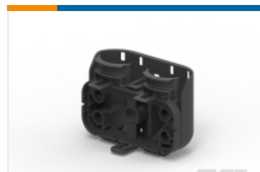
TE 产品编号0528-004-3805 BKSHL, 38P, BLK, PLG, RA