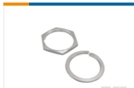
TE 产品编号114021-ZZ Mounting Hardware for DEUTSCH HD30 Connectors