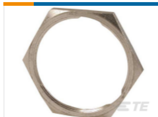
TE 产品编号112263-90 PANEL NUT, SIZE 24, HD30