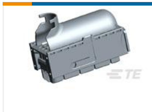
TE 产品编号3-1534904-2 CONNECTOR HSG 94 POS.