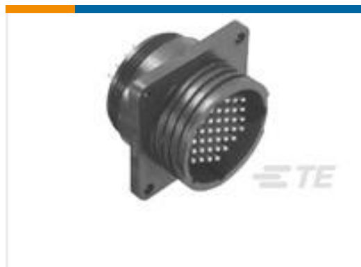
TE 产品编号1-207303-3 CPC RECPT ASSEMBLY SIZE 17-16