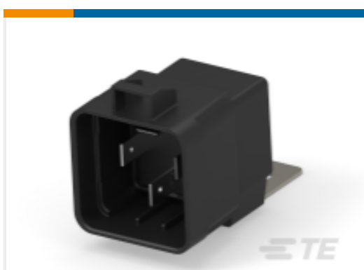
TE 产品编号3-1904131-0 V23134B4052X546-EV-CBOX