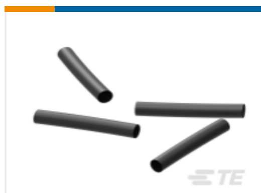
TE 产品编号EK5493-000 ES2000-NO.8-A1-0-2IN