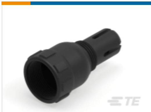
TE 产品编号M902-2131 BKSHL, 3SZ, CBL SZ .187-.300, HD10