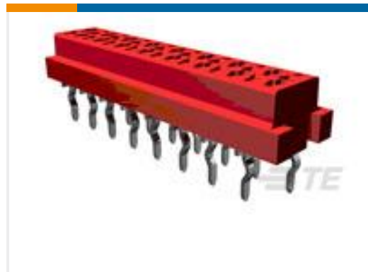
TE 产品编号7-215079-4 MICRO-MATCH FOB.04P