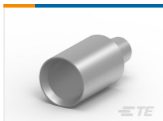
TE 产品编号HC5739 95MM2 NEGBAT LEAD 1/4" UNC THREAD