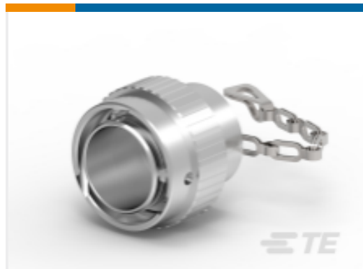
TE 产品编号HDC36-18 DUST CAP, 18SZ, REC, AL, LANYARD, HD30