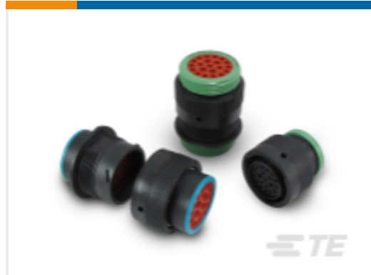
TE 产品编号HDP24-24-23PN DEUTSCH HDP20 Housings