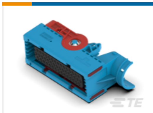
TE 产品编号3-2112231-3 46POS,AMP MCP1.5K,REC HSG,ASSY