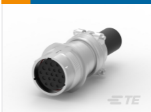
TE 产品编号HD34-24-19SE-059 REC,19P,AL,E,CBLCLMP BT,DRAIN,12 /16,S,MC