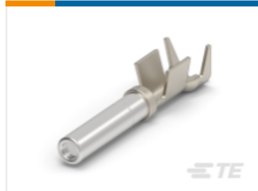
TE 产品编号1062-16-1244 SOC, SF, SIZE 16, 12-16, AU/SN