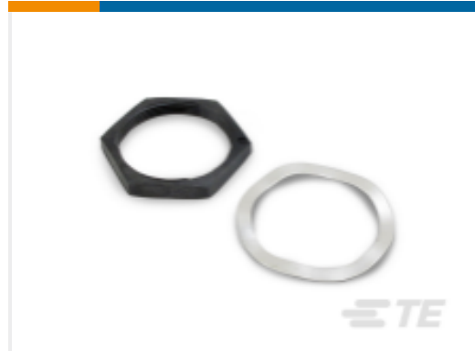
TE 产品编号2414-002-1886 Lockwashers and Panel Nuts for Deutsch HDP20