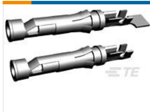
TE 产品编号66428-4 III+ SKT,30-26,30AU/FL,LP