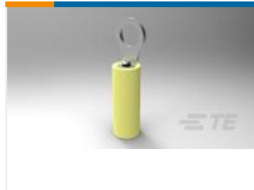
TE 产品编号323913 TERMINAL,PIDG R 26-22 2