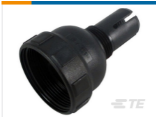
TE 产品编号M902-2191 BKSHL, 9SZ, CBL SZ .187-.300, HD10