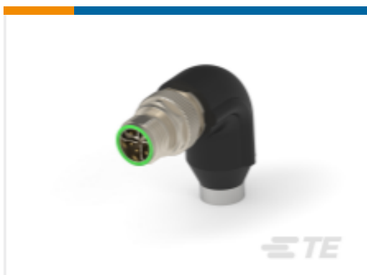
TE 产品编号2350791-1 M12 X-M-8,90,CRIMP,CAT7,H&S 84124806