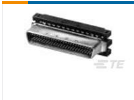
TE 产品编号5749621-9 100 50S CABLE PLUG CONN/COV KI