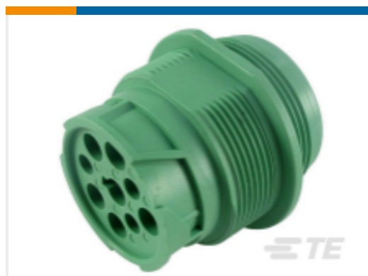
TE 产品编号HD10-9-1939PE-BP03 RECP ASM