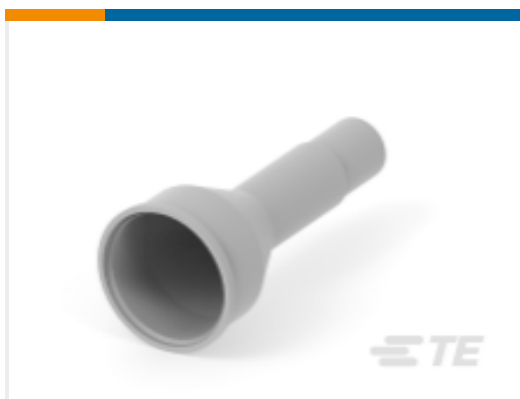
TE 产品编号HD10-6BT BOOT, 6P, PLG/REC, ST, GRY