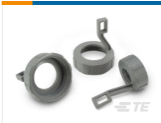
TE 产品编号M902-2163 DEUTSCH HD10 Backshells