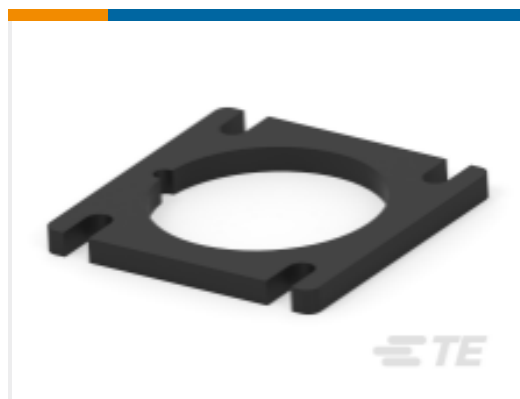
TE 产品编号HD10-6-GKT GASKET, 6SZ, BLK, HD10