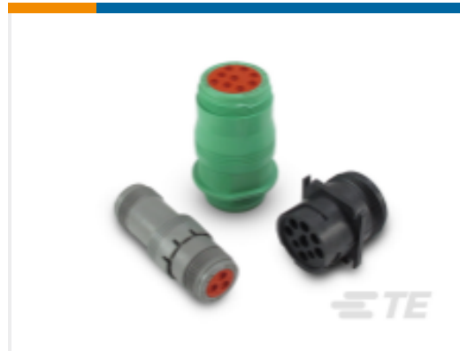
TE 产品编号HD14-6-96P DEUTSCH HD10 Housings