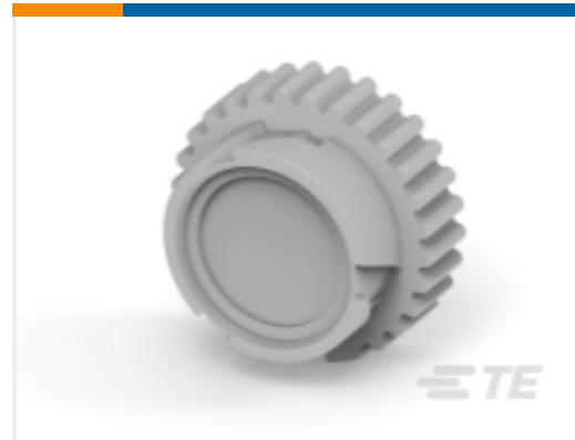
TE 产品编号HDC14-6 DUST CAP, 6P, PLG, GRY, HD10