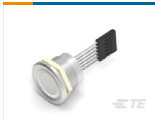
TE 产品编号2342843-4 AVP22M CONC. S16 RGB R 500MM /1X6