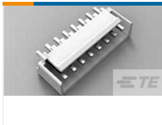
TE 产品编号1-1877285-2 12P EP SHRD HDR ASMY, WHITE