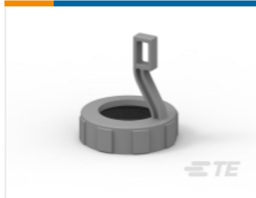
TE 产品编号HD18-009 BACK SHELL