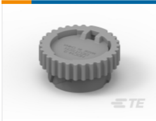
TE 产品编号HDC14-9 DUST CAP, 9P, PLG, GRY, HD10