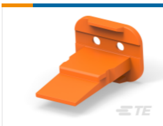
TE 产品编号W2S-P070-Y SEAL RETN WEDGE. ORANGE DT 2 W