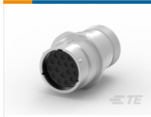
TE 产品编号HD34-24-16SN-072 REC, 16P, AL, N, THD ADPT, DRAIN, 12, S