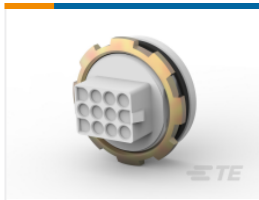
TE 产品编号1-1604941-1 UMNL BULKHEAD CONN, 12 POS