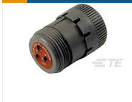
TE 产品编号HD16-3-96S PLUG ASM