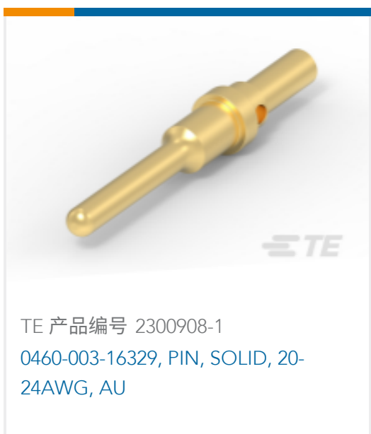
TE 产品编号 2300908-1 0460-003-16329, PIN, SOLID, 20-24AWG, AU