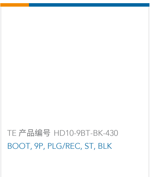
TE 产品编号 HD10-9BT-BK-430 BOOT, 9P, PLG/REC, ST, BLK