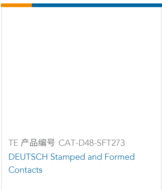
TE 产品编号 CAT-D48-SFT273 DEUTSCH Stamped and Formed Contacts