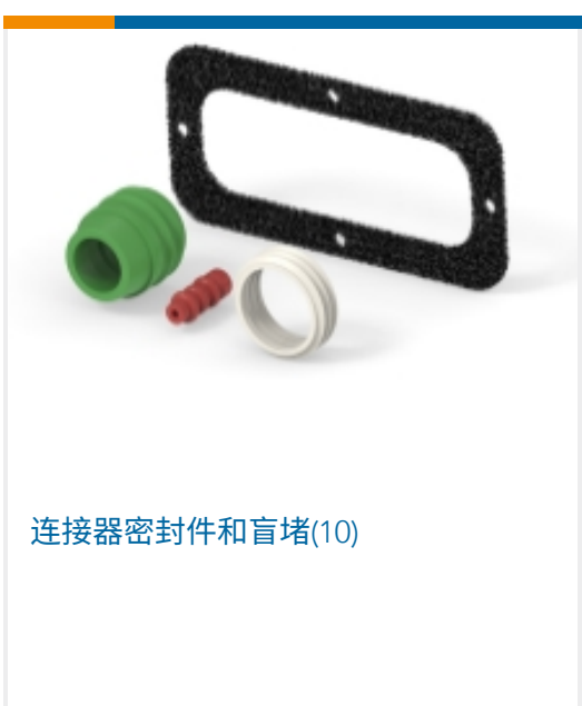
连接器密封件和盲堵(10)