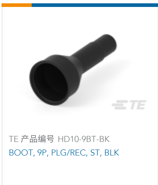
TE 产品编号 HD10-9BT-BK BOOT, 9P, PLG/REC, ST, BLK