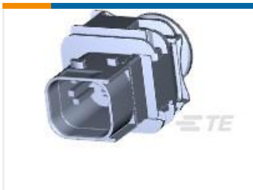
TE 产品编号2-1703773-1 6POS,TAB 1.6X0.6,PIN HSG,ASSY