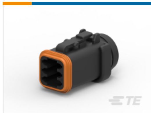
TE 产品编号DT06-6S-LC01 PLG, 6P, BLK, E, SEAL RET,DIN BKSHL ADPT