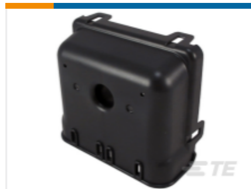
TE 产品编号4828-007-8605 BKSHL, 86P, BLK, VERTICAL, DRCP