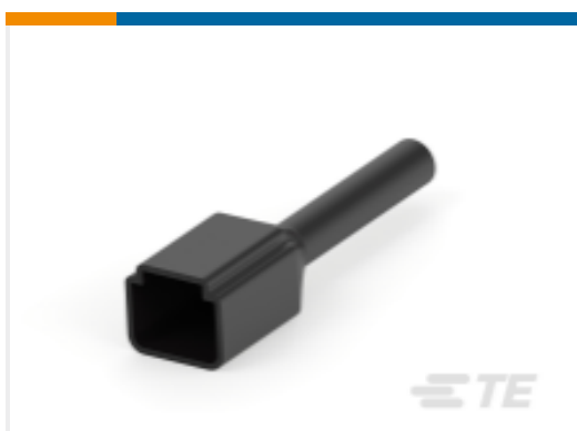
TE 产品编号DTP2P-BT-BK BOOT, 2P, REC, ST, BLK