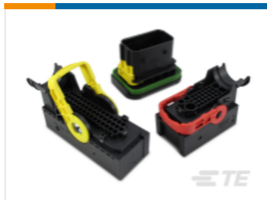
TE 产品编号2-2112162-1 LEAVYSEAL Housings