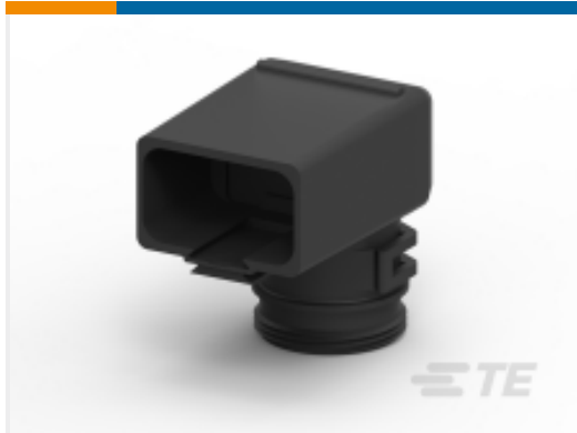
TE 产品编号1011-250-1205 BKSHL, 12P, BLK, REC,RA, NW10/13/17