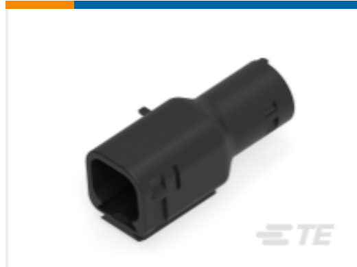
TE 产品编号1028-027-0405 BKSHL, 4P, BLK, REC, ST, NW 8.5