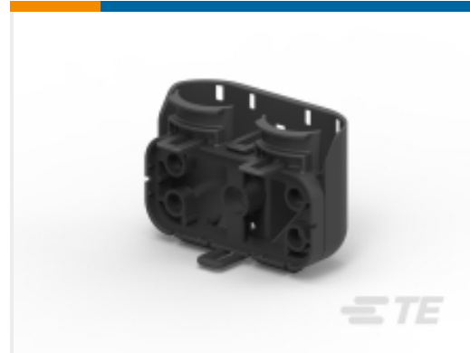
TE 产品编号0528-004-3805 BKSHL, 38P, BLK, PLG, RA