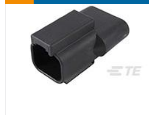
TE 产品编号DT04-2P-RT25 REC, 2P, BLK, 27K OHM RESISTOR, NI