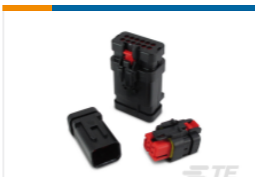
TE 产品编号776523-3 AMPSEAL 16 Housings