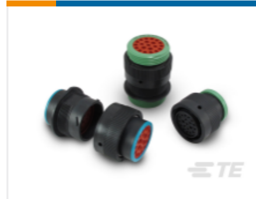
TE 产品编号HDP26-24-31PE-L015 DEUTSCH HDP20 Housings