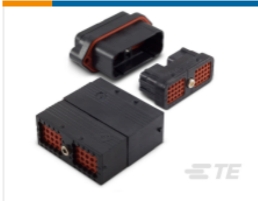
TE 产品编号DRC12-70PB DEUTSCH DRC Housings