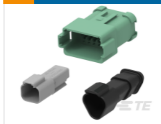
TE 产品编号DT04-3P-LE12 DEUTSCH DT Receptacle Connectors