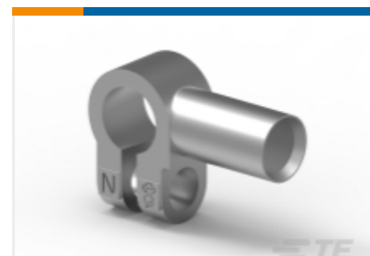
TE 产品编号HC5841 70MM2 BATTERY CLMP ASSMB NEGATIVE