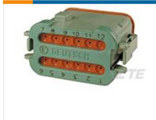
TE 产品编号DT06-12SC-CE05 PLG, 12P, GRN, E, SEAL RET, ENH KEY, CAP, C