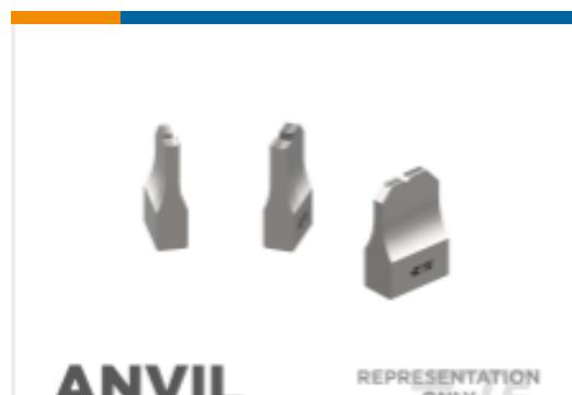
TE 产品编号3-1803059-1 ANVIL COMBINATION, END FEED