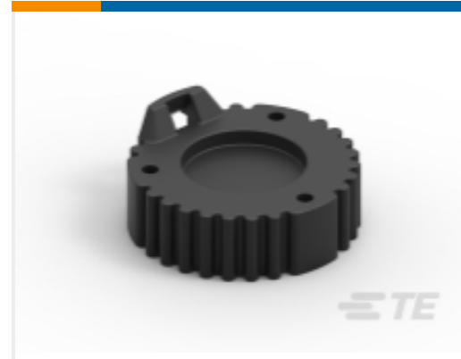
TE 产品编号HDC16-9-E004 DUST CAP ASM