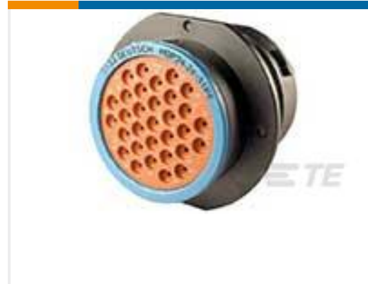
TE 产品编号HDP24-24-31PE REC, 31P, BLK, E, 16, P