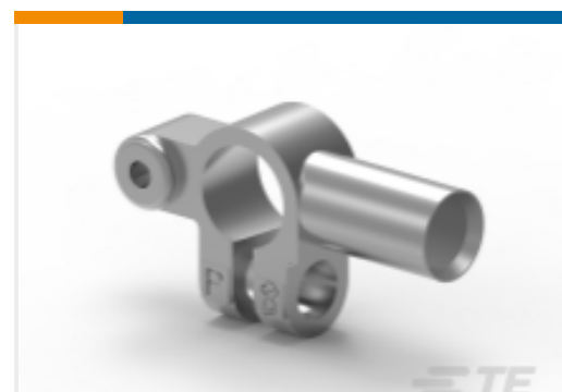
TE 产品编号HC5840D INTEGRAL BATT. POST. DOUBLE TAPER.