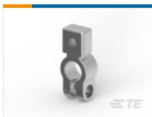
TE 产品编号HC5901 BATT.POST CLAMP -VE MK.3