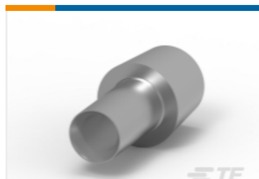
TE 产品编号HC5728 LEAD CONNECTOR 16MM