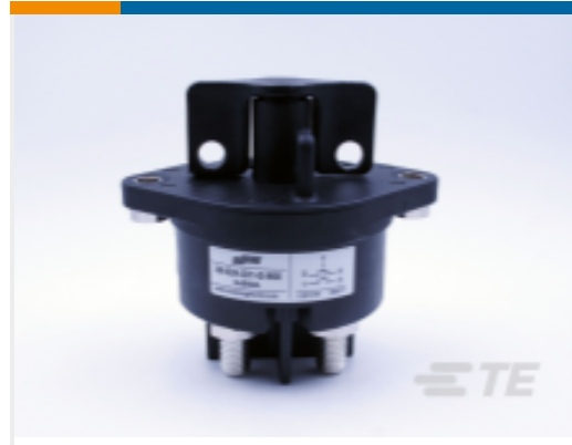
TE 产品编号K1121749 Battery Disconnecter 35-524-231-S-900