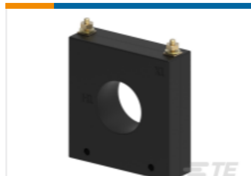
TE 产品编号CJ1147-000 CI-5SFT-501