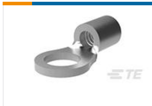
TE 产品编号2-34126-2 TERMINAL, SOLIS R 16-14 3/8