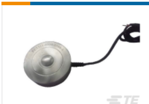
TE 产品编号FC2331-0000-2000-L FC23 AMPLIFIED 2FT CABLE 2000L