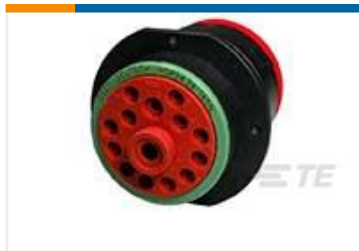
TE 产品编号HDP24-24-14SN REC, 14P, BLK, N, 4/12/16, S