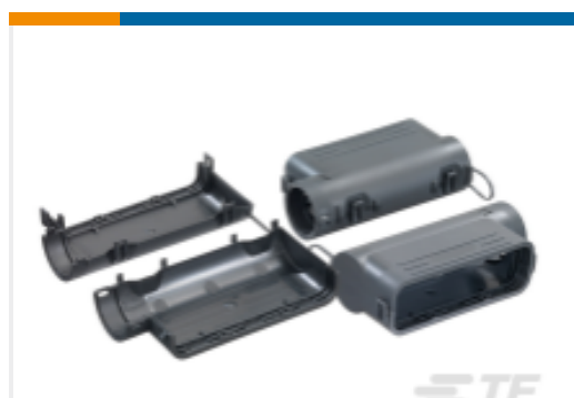
TE 产品编号1-2500035-6 SRC Male Conduit Cover