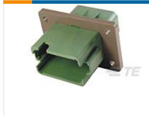
TE 产品编号DT04-12PC-BL04 REC, 12P, GRN, N, ENH KEY, FLANGE, C