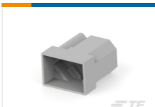
TE 产品编号K1007168 Steckhuelsengeh. 08-2-2-05 08-80-125