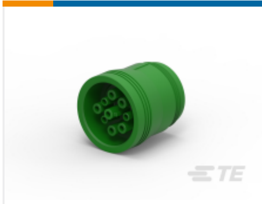
TE 产品编号HD17-9-1939S-P080 PLUG ASM