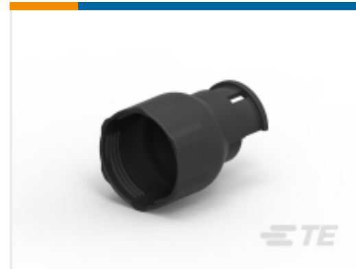
TE 产品编号2428-025-1805 BKSHL, 18SZ, BLK, ST, L024, HDP