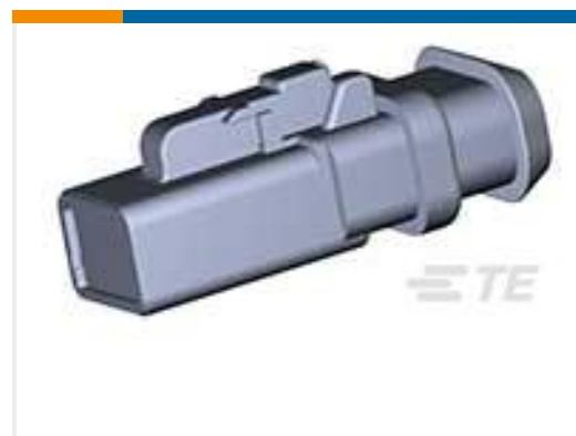
TE 产品编号DTP06-2S-EE01 PLG, 2P, BLK, N, XCAP