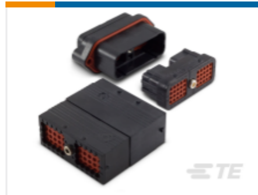
TE 产品编号DRC12-24PB DEUTSCH DRC Housings