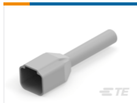
TE 产品编号DTP4P-BT BOOT, 4P, REC, ST, GRY