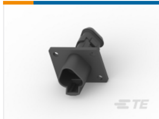
TE 产品编号DT04-3P-LE12 REC, 3P, BLK, N, XCAP, FLANGE