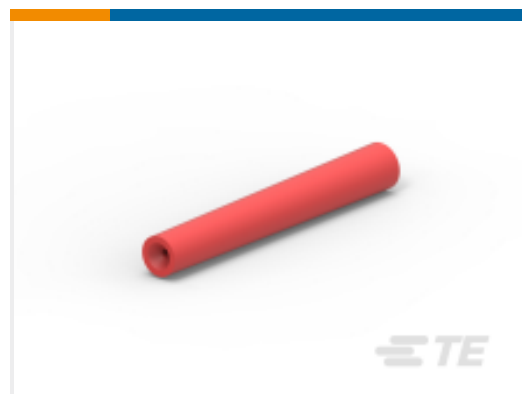
TE 产品编号JS-16-00 JIFFY SPLICE, Size 16