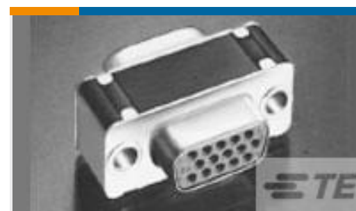
TE 产品编号212562-2 AMPLIMITE CONN SVR,37 POS,TRW