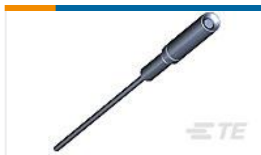
TE 产品编号207684-5 AMPLIMITE,SKT CONT,SZ 22