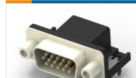
TE 产品编号2311775-1 AMPL PLUG, HD22, R/A, 15P, S/L