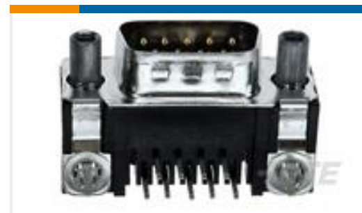
TE 产品编号5747842-6 25 MSFL PLUG RA 318 (SL,FM,BL)