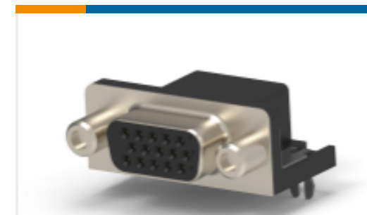
TE 产品编号2311763-1 AMPL REC, HD22, R/A, 15P, S/L