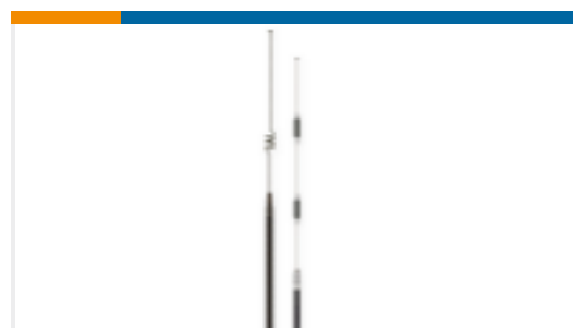
TE 产品编号EB8965C WHIP,EF,CT,896-970MHz 933MHz,5, BK,GP,