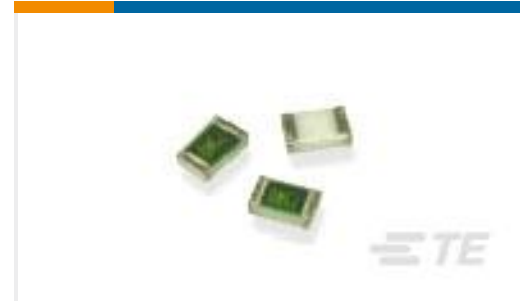
TE 产品编号1676349-3 RN 0805 47K5 0.1% 10PPM 5KRL