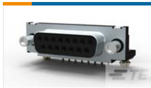
TE 产品编号5747845-6 15 MSFL RCPT RA 318 (SL,FM,BL)