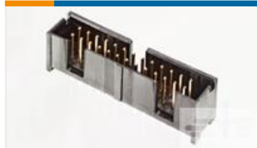
TE 产品编号103309-2 014 LOPRO HDR SP 30DP