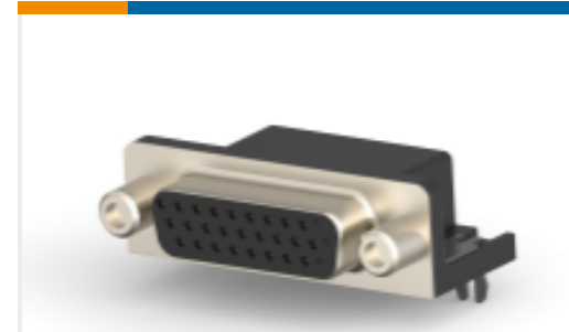
TE 产品编号2311768-1 AMPL REC, HD22, R/A, 26P, THREADED