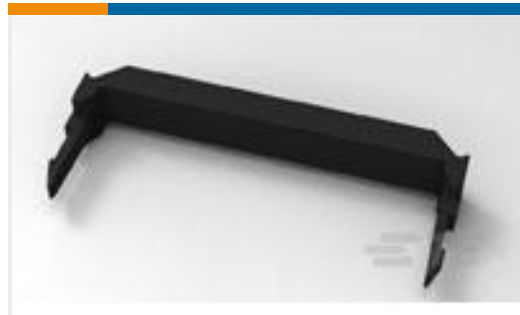
TE 产品编号499252-6 034 STRAIN RELIEF A-L RCPT