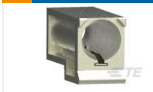
TE 产品编号1-1469492-9 MULTIGIG RT 9MM GUIDE/ESD UNKE