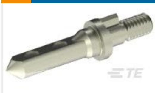
TE 产品编号1-1469491-3 MULTIGIG RT GUIDE PIN, 9MM 4.20