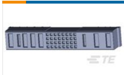
TE 产品编号1-6450869-4 V/R 2ACP+1LP+32S+3HDP+1LP+1P