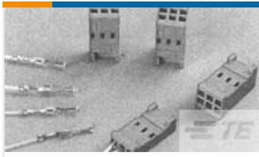
TE 产品编号281839-5 HOUSING HE13 HE14 COSI 2X5 P