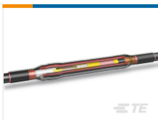
TE 产品编号300623-000 HVS-1583D