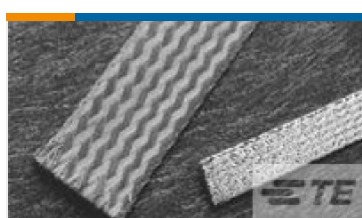
TE 产品编号125589-000 HV-BRAID-8-1520