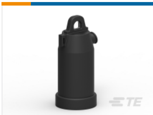
TE 产品编号EE5633-000 ELB-15-200-IC