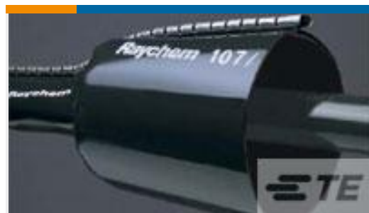
TE 产品编号298891-000 CRSM-84/20-750