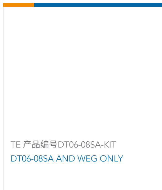
TE 产品编号DT06-08SA-KIT DT06-08SA AND WEG ONLY