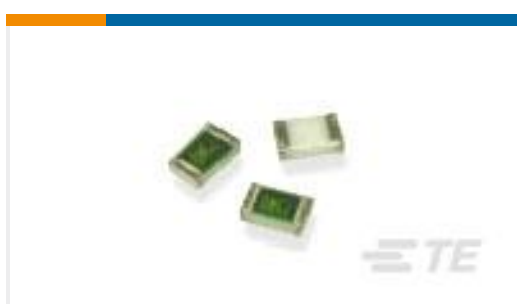
TE 产品编号8-1625868-5 RP 2A 0.25W 40R2 0.1% 25PPM 1K RL