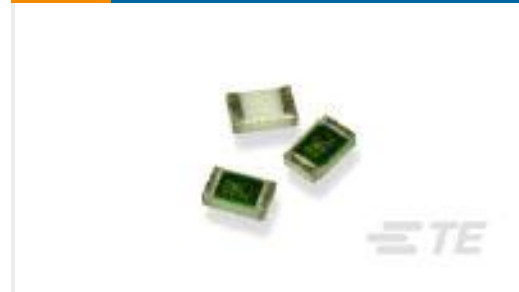
TE 产品编号9-1879221-7 CPF 0603 16R9 0.1% 25PPM 1K RL