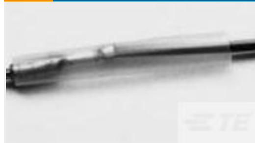
TE 产品编号CV25894001 RW-175-E-1/2-X-SP