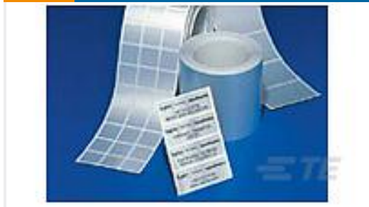
TE 产品编号F07599-000 MP-508254-5-8A