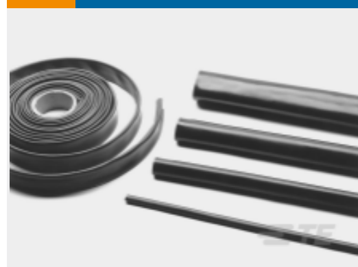
TE 产品编号F67816-000 RT-780-3/16-0-SP