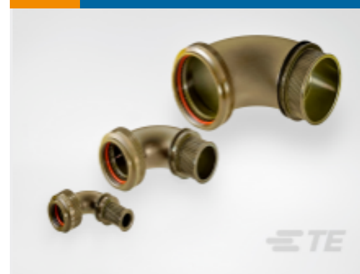
TE 产品编号AAF7065-00 BTH3-17-09-1-ZN-SE