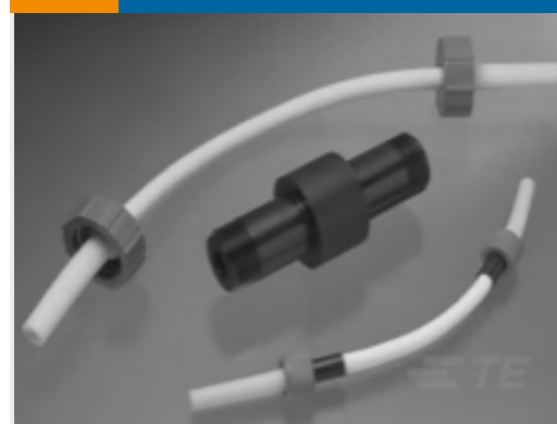
TE 产品编号862514-1 LGH-1/2 MLD. END, BOOT KIT