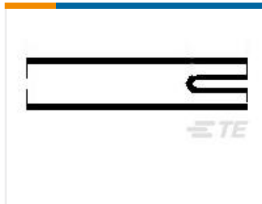
TE 产品编号CX4639-000 302A821-4/180-0