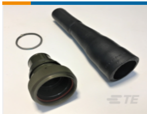
TE 产品编号808853N001 202D242-3-61/42-0-CS5077