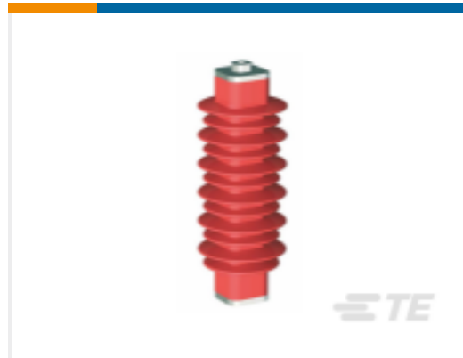
TE 产品编号EN6028-000 HDA-33M-B3-NFF