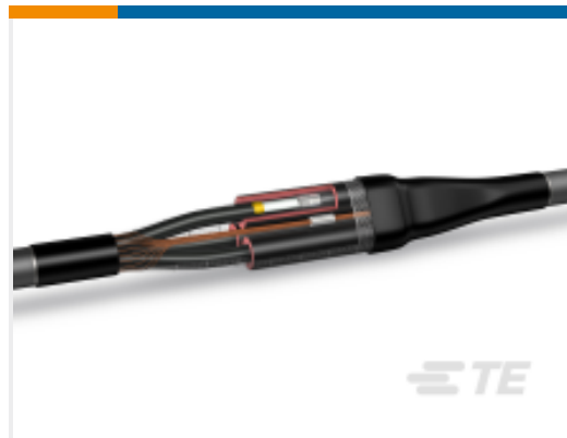
TE 产品编号D11309-070 POLJ-12/3X25-70