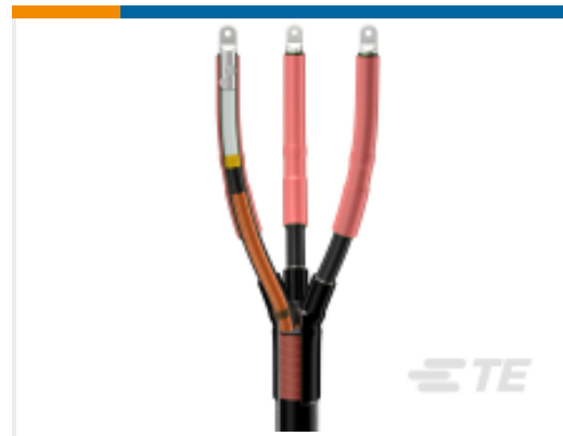
TE 产品编号E92435-063 POLT-12D/3XIH1