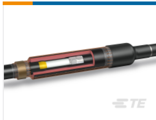
TE 产品编号E67139-069 POLJ-24/1X120-240