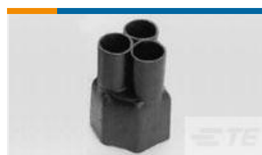
TE 产品编号195702-001 T3-9FR