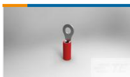
TE 产品编号51863 TERM, R, PIDG, 22-16/22-18, #6(M3.5)