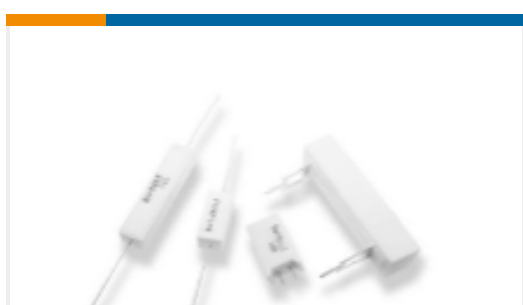
TE 产品编号1-1623793-7 线圈电阻器：水平安装