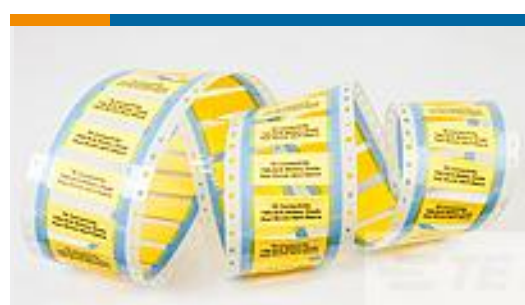
TE 产品编号5414710001 TMS-SCE-1-1/2-2.0-9