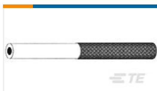
TE 产品编号C750743001 RAY-103-3.0(100)