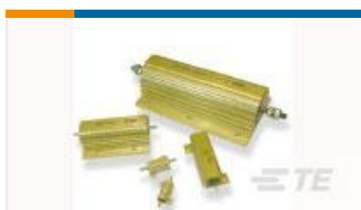
TE 产品编号6-1625984-1 HSA50 47R 5%