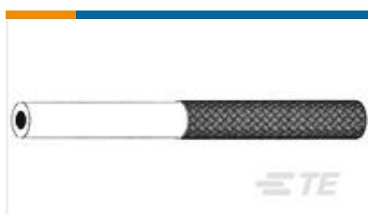
TE 产品编号1384453002 RAY-103-20.0(50)