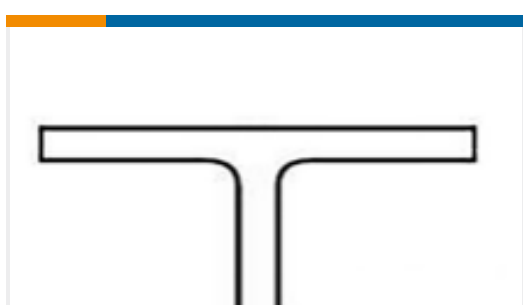
TE 产品编号728038-000 301A511-125-0