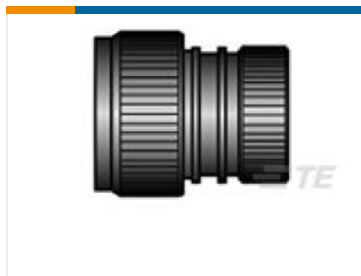
TE 产品编号527781-000 HEX40-AC-00-15-A5-1