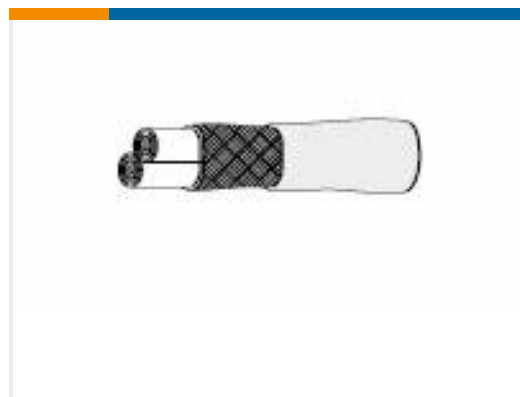
TE 产品编号272103-000 55A1123-20-9/96-9CS2275