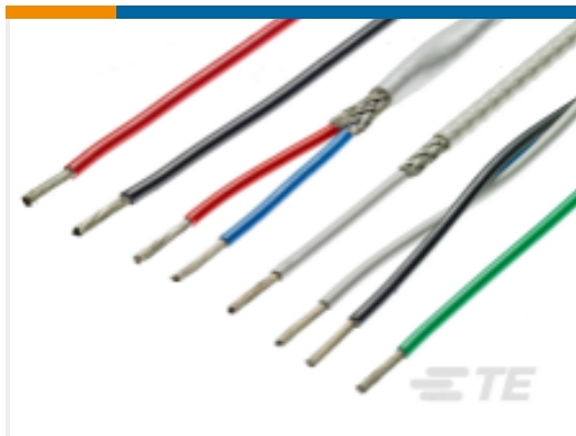
TE 产品编号2823013001 44A0211-8-9