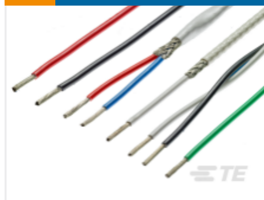
TE 产品编号2611473001 44A0111-12-54