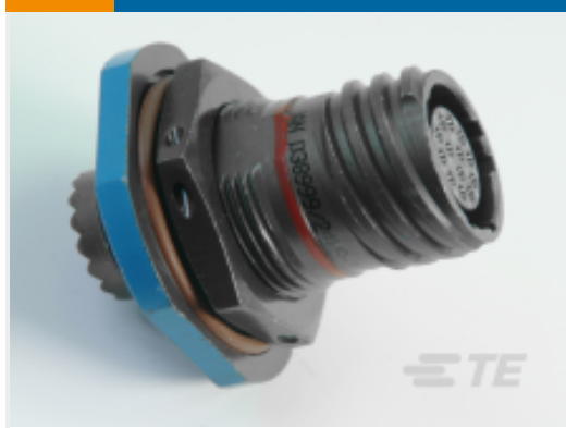
TE 产品编号YDTS24Z25-19PNV001 RECP ASSY