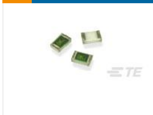
TE 产品编号6-1879127-7 RN 0402 422R 0.1% 10PPM CUT LENGTH