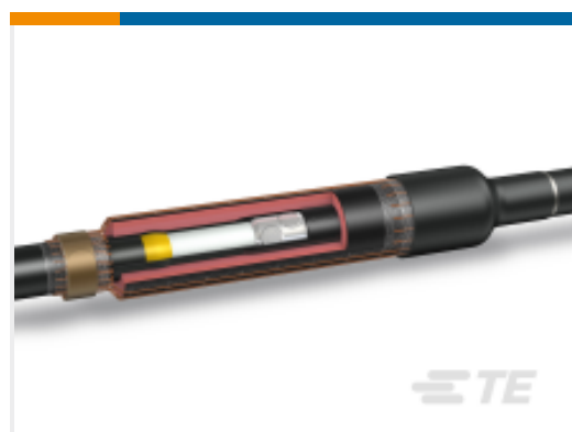
TE 产品编号D92225-000 POLJ-01/5X4-16(S10)