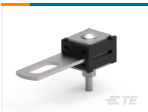
TE 产品编号099822-000 HEL-5505