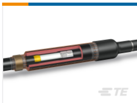
TE 产品编号577424-000 POLJ-01/5X1-6(S10)