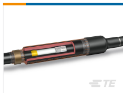
TE 产品编号E67139-069 POLJ-24/1X120-240