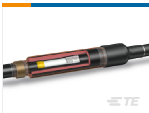
TE 产品编号C95685-000 POLJ-01/4X25-70(S10)