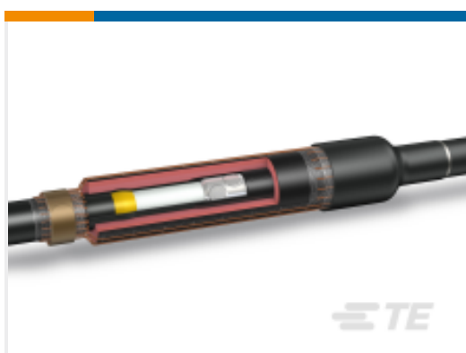
TE 产品编号E98079-000 POLJ-01/5X10-35(S10)