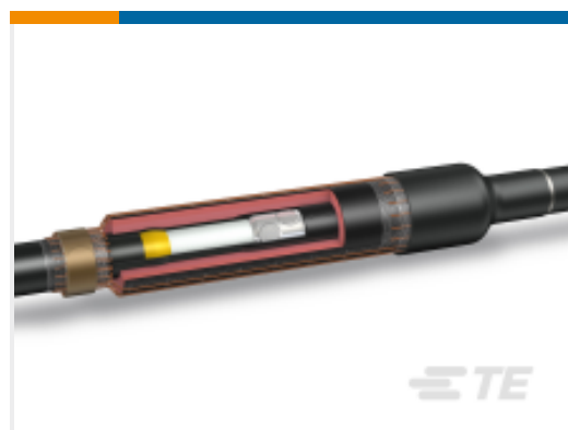
TE 产品编号C09539-000 POLJ-01/4X10-35(S10)