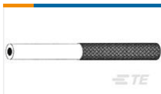
TE 产品编号E234513001 RAY-103-10.0(100)