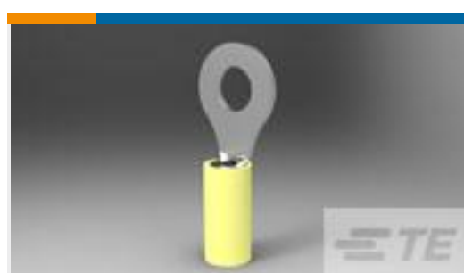
TE 产品编号2-35110-1 PIDG 12-10 R 1/4; TAPE