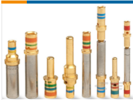
TE 产品编号ZPF000000000003592 724-0001-20