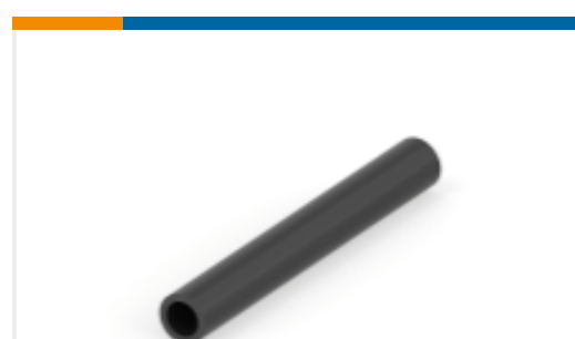
TE 产品编号NB07552001 HTAT 热缩管