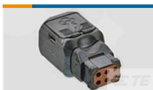
TE 产品编号D369-R66-NP1 369 6 WAY REC, CRIMP, PIN