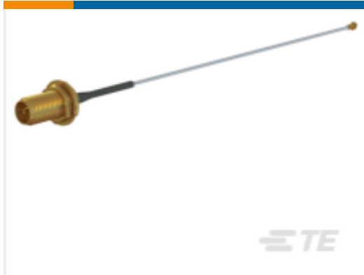
TE 产品编号CARSMF10AMH4L-001 CABLE ASSY,D1.13,100MM RP-SMAF, MHF4L