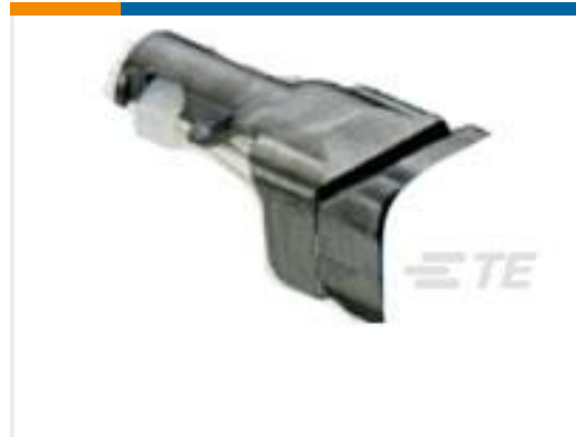
TE 产品编号D369-STB-6 369 6 WAY BACKSHELL STRAIGHT TIE WRAP