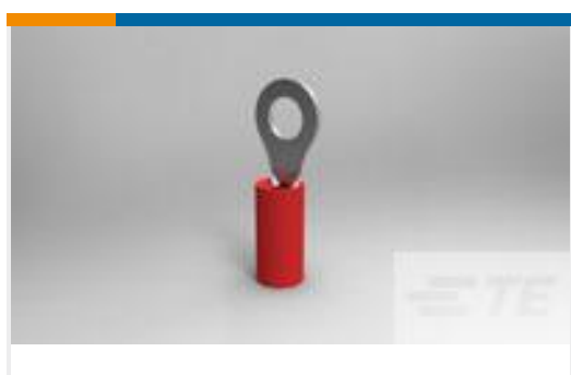
TE 产品编号171508-5 PIDG RING UL.CSA(22-16)