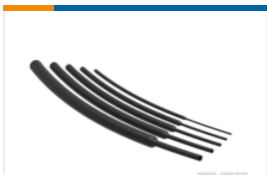
TE 产品编号A81736-000 RNF-100-BK 热缩管