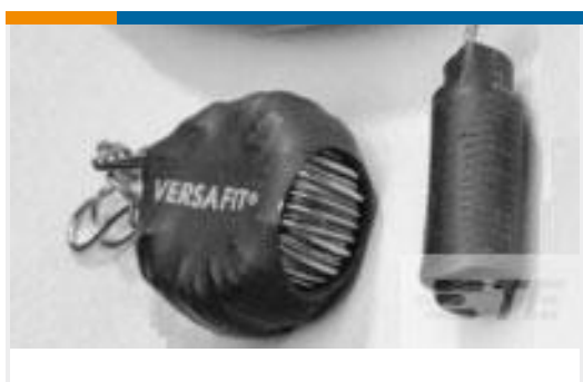
TE 产品编号D70981-000 VERSAFIT-MINI-SPL-3/32-BK