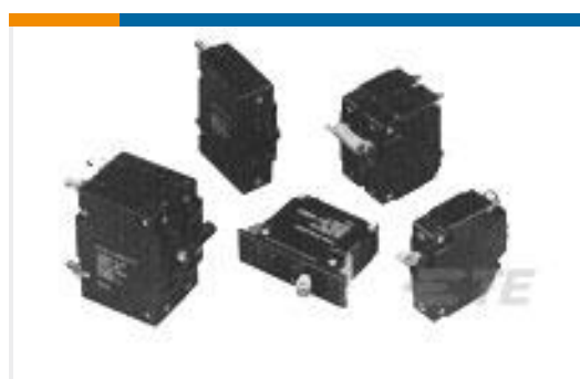
TE 产品编号8-1393254-1 W92-X112-5=M6/M7/M9/W6/W7