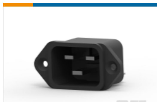
TE 产品编号4-1609134-7 20ESRM-3=F8277