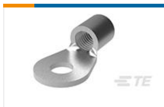
TE 产品编号35185 TERMINAL,SOLIS R 2 1/2