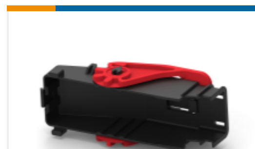
TE 产品编号2035037-1 WIRE DRESS ASSY, 96P LOW PROF