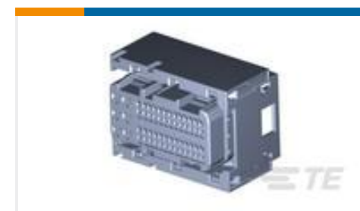
TE 产品编号9-1452415-7 58 POS MIXED, MCON CONNECTOR