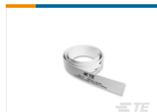
TE 产品编号EL7660-000 TMS-CT-50M-3/32-OUT-9