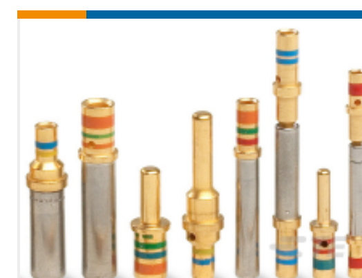
TE 产品编号ZPF000000000003651 724-8022-16