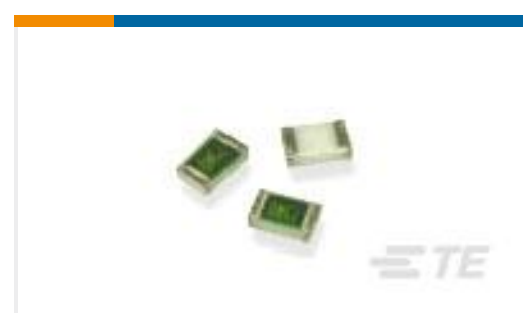
TE 产品编号1676216-2 RN 0805 19K1 0.1% 10PPM 1KRL