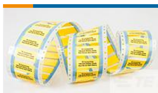
TE 产品编号4554650001 TMS-SCE-1K-1/8-2.0-9