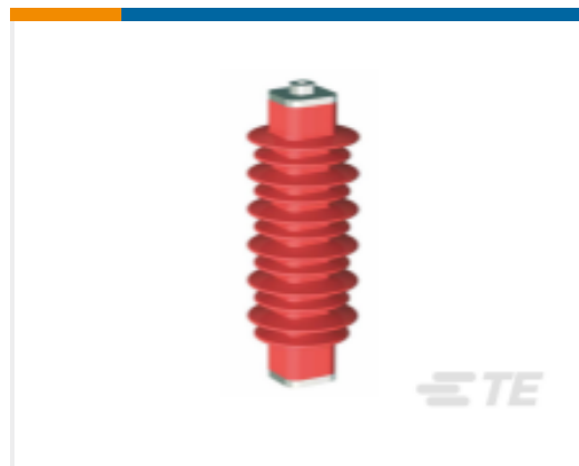
TE 产品编号EN6028-000 HDA-33M-B3-NFF