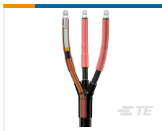
TE 产品编号E92435-063 POLT-12D/3XIH1