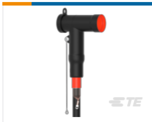
TE 产品编号CM0012-072 屏蔽式可分离连接器 1250 A