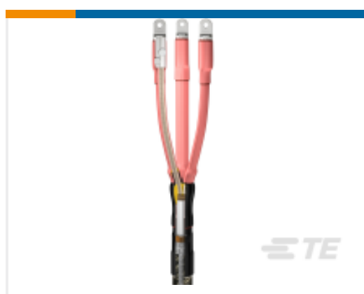
TE 产品编号C47372-064 GUST-12/25-50/800