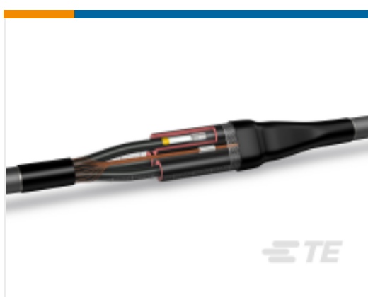
TE 产品编号A69078-064 POLJ-12/3X70-150