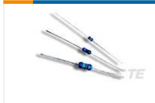
TE 产品编号2176210-1 LR200 1% 820R