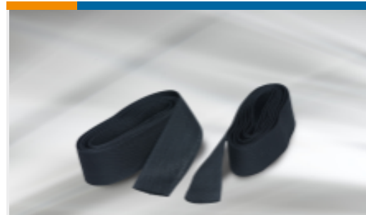
TE 产品编号EL88406001 HFT5000 热缩管