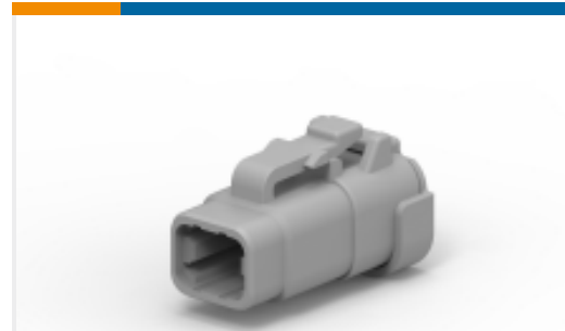
TE 产品编号2298287-1 DTM06-4S-E003, PLG, 4P, GRY, N, CAP