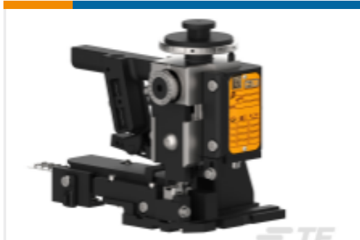
TE 产品编号2266503-1 OCEAN_2.0_Applicator-S-100F130O