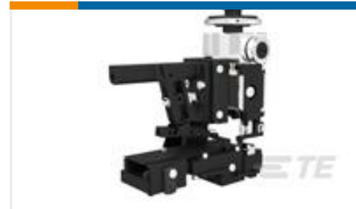
TE 产品编号2151738-1 OCEAN_2.0_Applicator-S-055F069O