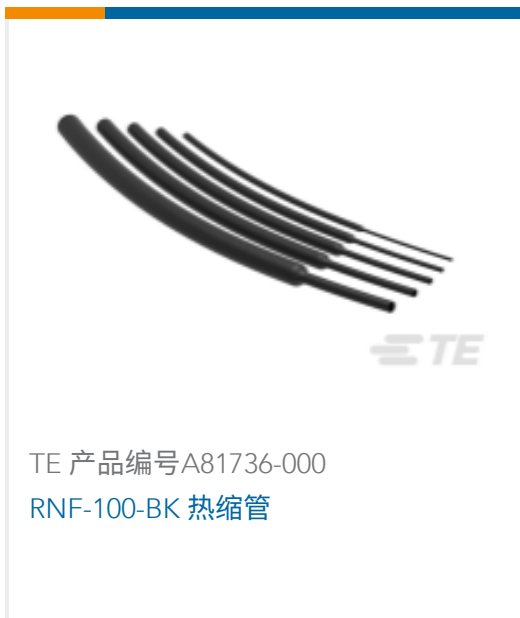
TE 产品编号A81736-000 RNF-100-BK 热缩管