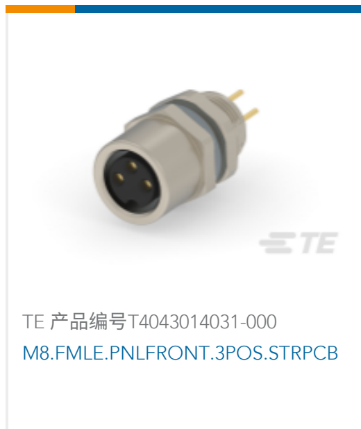
TE 产品编号T4043014031-000 M8.FMLE.PNLFRONT.3POS.STRPCB