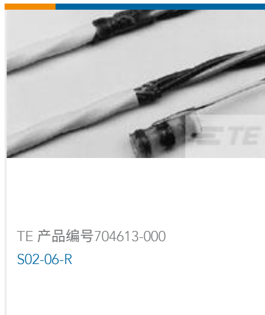
TE 产品编号704613-000 S02-06-R