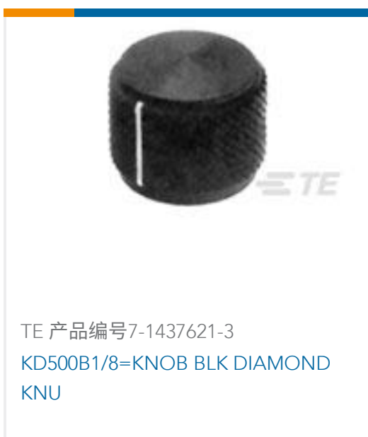
TE 产品编号7-1437621-3 KD500B1/8=KNOB BLK DIAMOND KNU