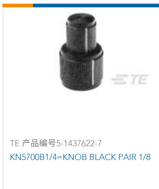
TE 产品编号5-1437622-7 KN5700B1/4=KNOB BLACK PAIR 1/8