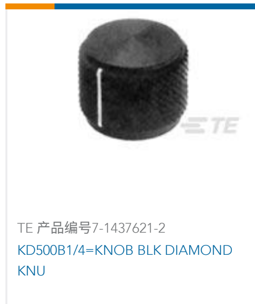
TE 产品编号7-1437621-2 KD500B1/4=KNOB BLK DIAMOND KNU