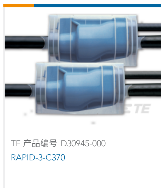
TE 产品编号 D30945-000 RAPID-3-C370