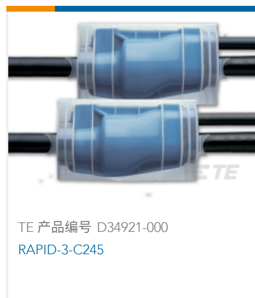
TE 产品编号 D34921-000 RAPID-3-C245