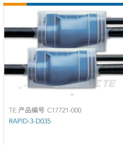
TE 产品编号 C17721-000 RAPID-3-D035