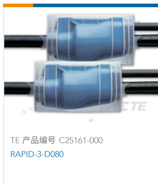
TE 产品编号 C25161-000 RAPID-3-D080