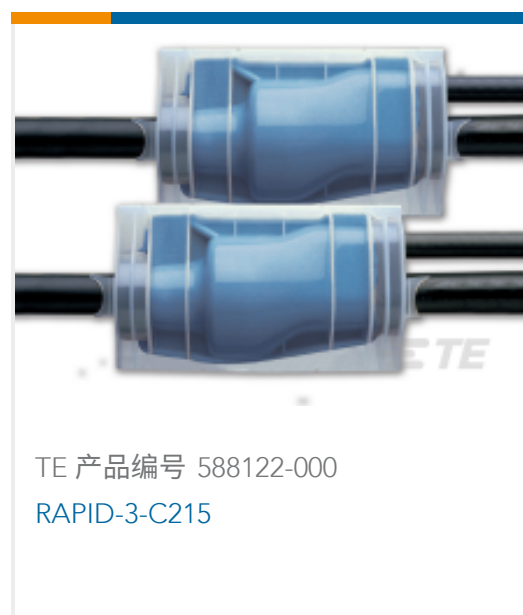
TE 产品编号 588122-000 RAPID-3-C215