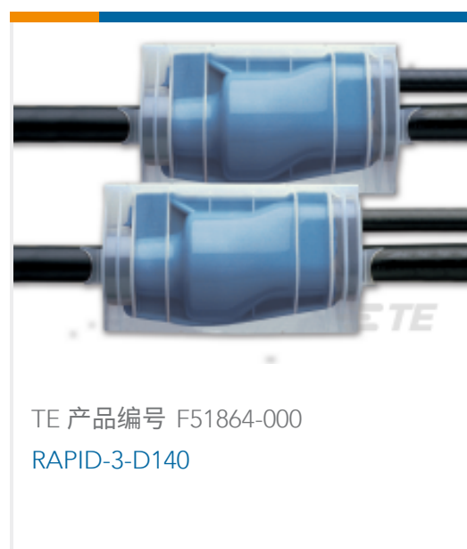
TE 产品编号 F51864-000 RAPID-3-D140