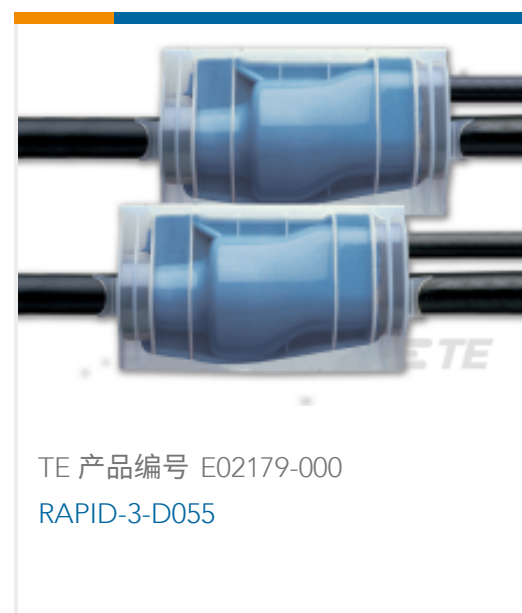
TE 产品编号 E02179-000 RAPID-3-D055