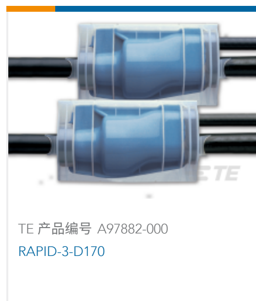
TE 产品编号 A97882-000 RAPID-3-D170