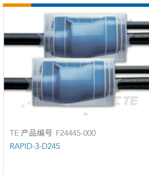
TE 产品编号 F24445-000 RAPID-3-D245