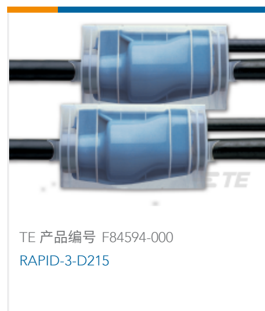
TE 产品编号 F84594-000 RAPID-3-D215