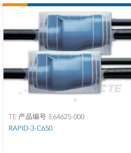
TE 产品编号 E64625-000 RAPID-3-C650