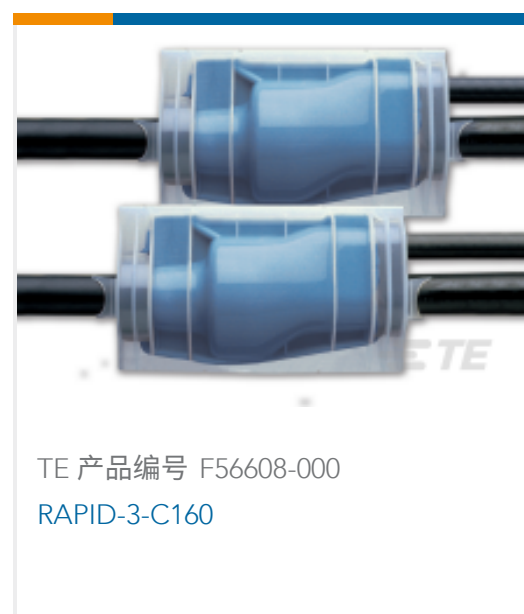
TE 产品编号 F56608-000 RAPID-3-C160