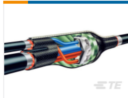
TE 产品编号728079-000 BMHM-1001-4D2