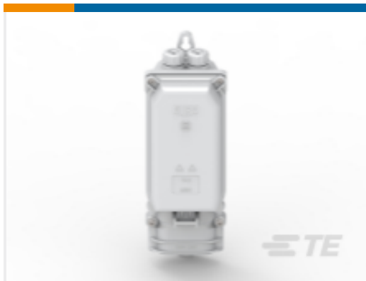
TE 产品编号612804-000 EKM-1281-1D2-5X25-2PG-C2