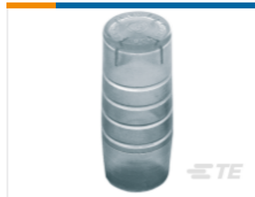
TE 产品编号CN1960-000 GURO-CEC-8/12