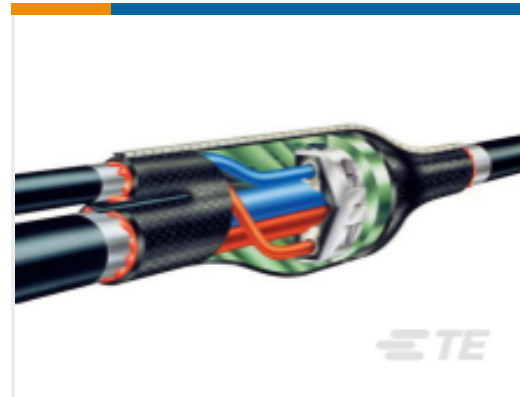
TE 产品编号977167-000 BMHM-1001-4C1(S4)