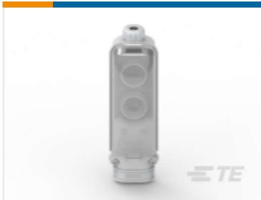
TE 产品编号541838-000 EKM-1272-2D2-4X16