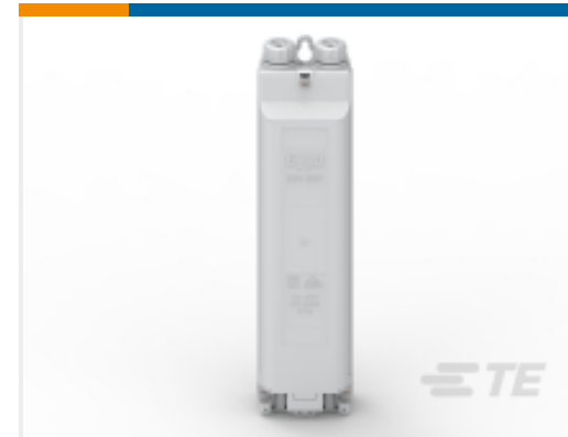
TE 产品编号C38579-000 EKM-2051FH-3D1-5S/U-1R/D