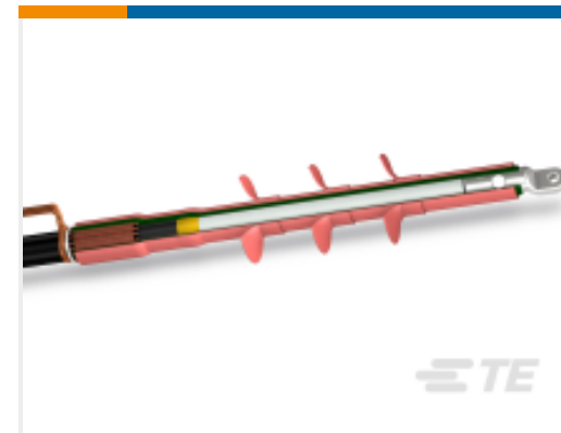
TE 产品编号F77770-014 POLT-24C/1XO