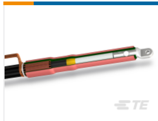
TE 产品编号CF6274-070 POLT-12C/1XI-ML-1-13