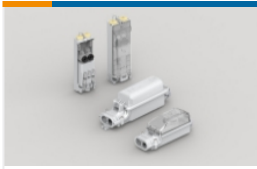
街道照明保险丝盒(200)