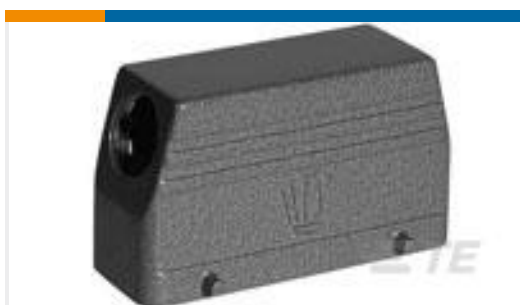
TE 产品编号2-1102319-6 HB-K.24.STS.1.29.G