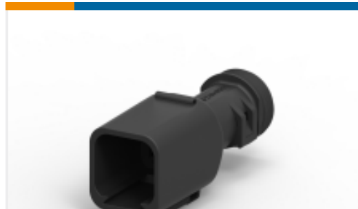
TE 产品编号1011-241-0605 BKSHL, 6P, BLK, REC, ST, NW8.5/10/13