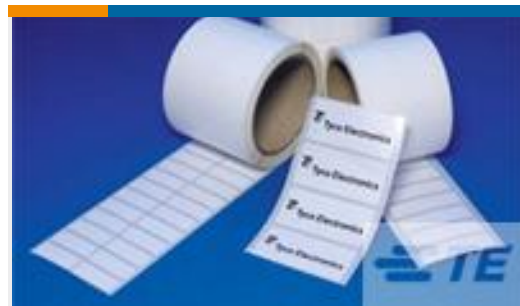
TE 产品编号8-1768018-1 EET-2570P-9