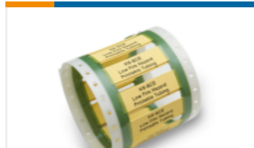
TE 产品编号F42475-000 HX-SCE-12.7-50-S1-4