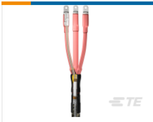
TE 产品编号C47372-064 GUST-12/25-50/800