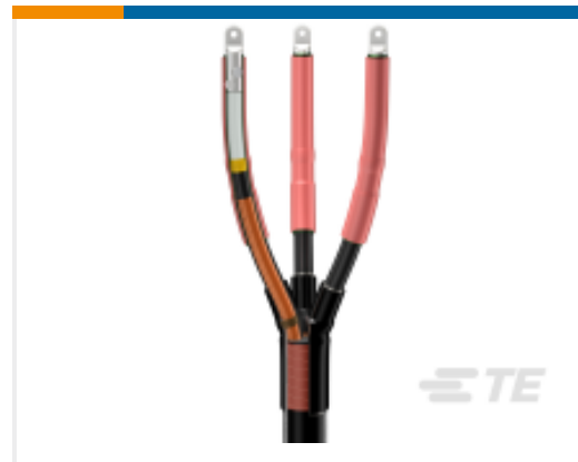
TE 产品编号E92435-063 POLT-12D/3XIH1