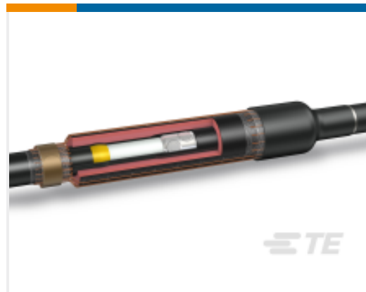
TE 产品编号E67139-069 POLJ-24/1X120-240