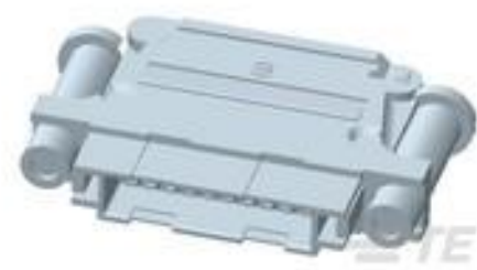
TE 产品编号 F67907-000 MTCPOKT1P2PFCA